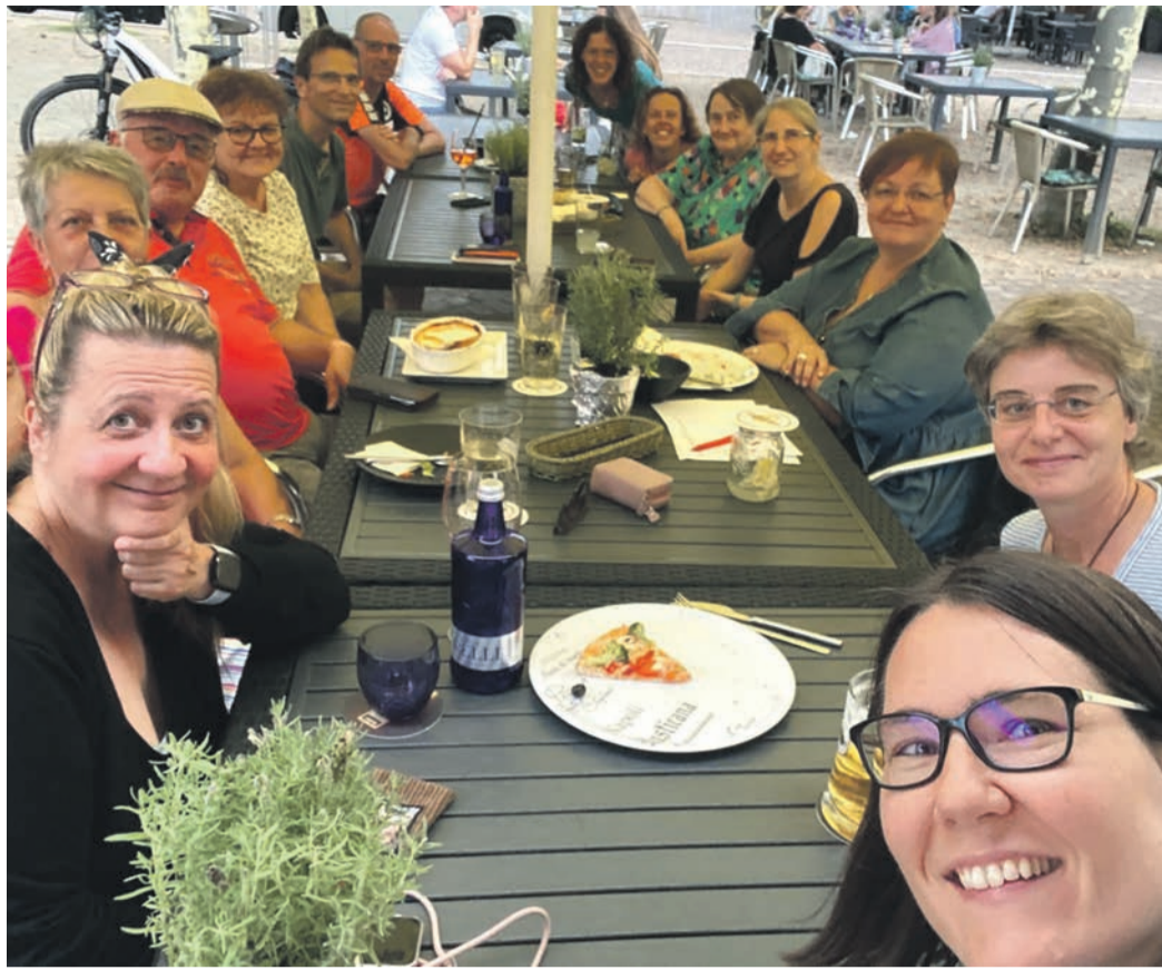
Probe mal anders.