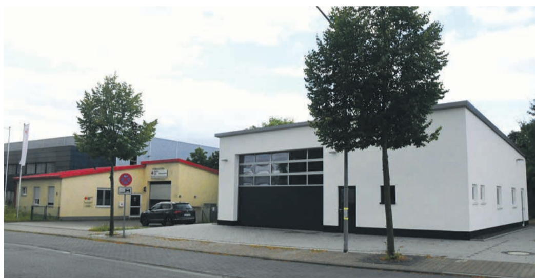
In Betrieb gegangen ist die neue Fahrzeughalle (weiße Fassade) des DRK Eppertshausen, die sich neben der Rettungswache im „Park45“ befindet. Zuvor musste das Rote Kreuz Fahrzeuge aus Platzmangel im Feuerwehr-Haus abstellen.

Kläranlage: Nach der Installation von 200 Photovoltaik-Modulen an der Eppertshäuser Kläranlage sind diese ans