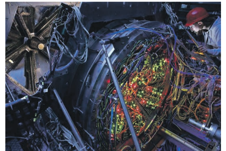
HADES-Detektor bei GSIFAIR, Darmstadt

Region (MA) „Voller Energie“ lautet das Thema der diesjährigen „Tage der Industriekultur Rhein-Main“. Das beliebte Veranstaltungsformat der KulturRegion öffnet vom 14. bis 22. September 2024 einem breiten Publikum spannende industriekulturelle Orte in der Metropolregion, die sonst nicht zugänglich sind. Mehr als 130 Veranstaltungen wie Betriebsführungen, Ausstellungen, Filmvorführungen, Rundgänge, Rad- und Schiffstouren laden in 29 Städten und Gemeinden dazu ein, Energie aus verschiedenen Perspektiven zwischen privater Verwendung, kommunaler Bereitstellung und geopolitischen Abhängigkeiten zu betrachten. Große und kleine Besucher*innen erfahren Wissenswertes über Technik sowie die Geschichte der Energieversorgung und -gewinnung. Darüber hinaus geht es um die Energien der Zukunft und die mit ihnen verbundenen Fragen, wie beispielsweise Transformationen bewältigt und gestaltet werden können. Interessierte finden alle Angebote auf der Website der KulturRegion unter www.krfrm.de . Aus Gründen der Nachhaltigkeit verzichtet die KulturRegion seit diesem Jahr auf ein gedrucktes Programm. Energie ist die Basis für die Industrie und somit, gestern wie heute, maßgeblich für die Entwicklung und Ausgestaltung der Kultur- und Industrieland-