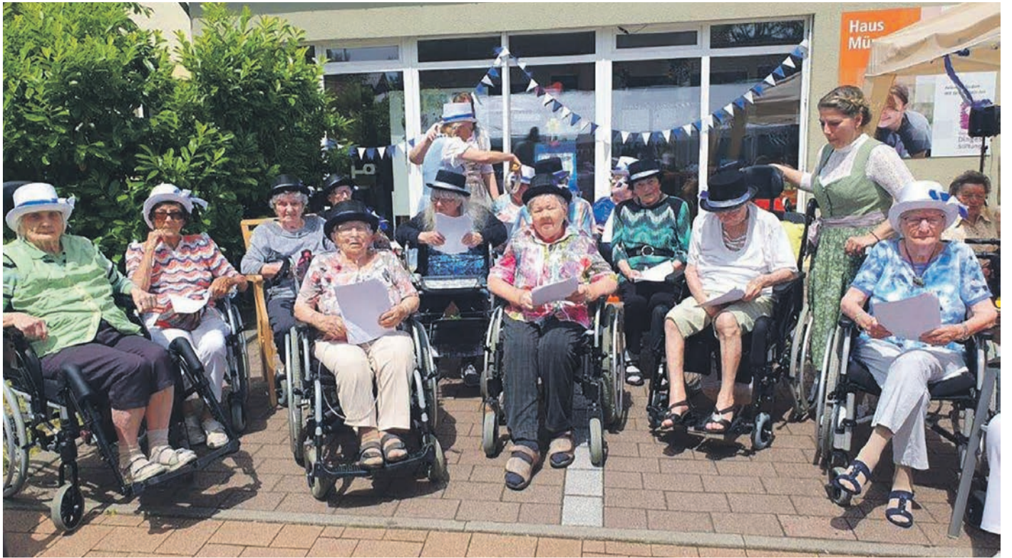
Für die Bewohnerinnen und Bewohner des Pflegeheims der „Gersprenz Seniorendienstleistungs gemeinnützige GmbH“ in Münster wird immer viel geboten, wie hier beim Sommerfest. In Kürze startet ein Theaterworkshop, den die Gemeinde Münster dort anbietet.

nennt. Die Gelder kommen vom Hessischen Ministerium für Wissenschaft und Kunst. Auf der Website findet sich eine „Perlenkette“ mit Kulturschaffenden in Hessen, die sich darüber vernetzen können. Kulturelle Bildung bedeutet mitgestalten/mitmachen. Das können auch ältere, nicht mehr mobile Menschen, fand Lena Brunn: „Ich wünsche mir, dass dadurch Kräfte reaktiviert werden, dass Selbst-