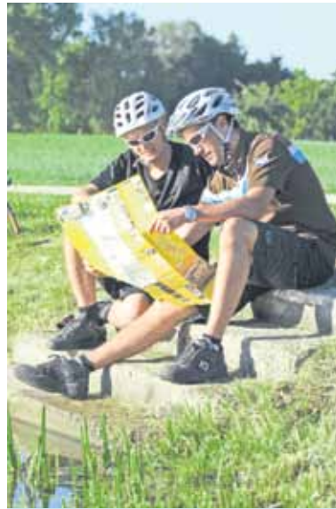
Wo geht es weiter? Am Weiher kann man entspannt die Route checken.

Für alle, die das Karpfenland rund um Feuchtwangen lieber zu Fuß erkunden möchten, gibt es sechs ausgewiesene Rundwege entlang