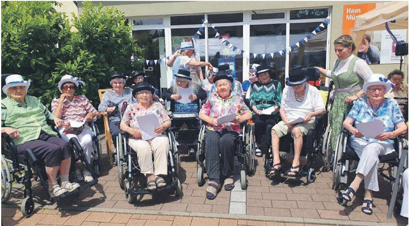
Für die Bewohnerinnen und Bewohner des Pflegeheims der „Gersprenz Seniorendienstleistungs gemeinnützige GmbH“ in Münster wird immer viel geboten, wie hier beim Sommerfest. In Kürze startet ein Theaterworkshop, den die Gemeinde Münster dort anbietet.