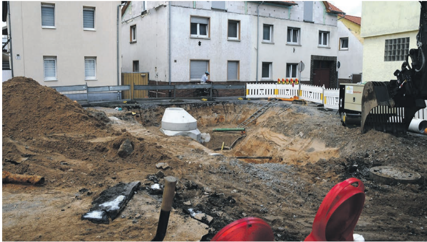
Kein Durchkommen gibt es für Autofahrer derzeit an der Kreuzung von Friedrich-Ebert-Straße, Friedhofstraße und Rathenastraße. Dort werden erst der Kanal und dann die Fahrbahn erneuert.

Zugleich strebt die Gemeinde für die Ebert-Straße als wichtiger Ost-West-Verbindung einen „Markierungsplan“ an, in dem die Anordnung von Parkplätzen