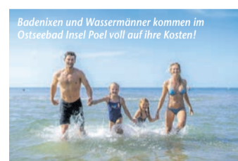
Badenixen und Wassermänner kommen im Ostseebad Insel Poel voll auf ihre Kosten!

Meer erleben! – Das Ostseebad Insel Poel ist ein Hotspot für Wassersportler (epr) In die Berge oder ans Meer? Für Badenixen und Wassermänner stellt sich diese Frage erst gar nicht! Sie werden magisch von rauschenden Wellen angezogen, die an den Strand rollen – egal ob an der Küste oder auf