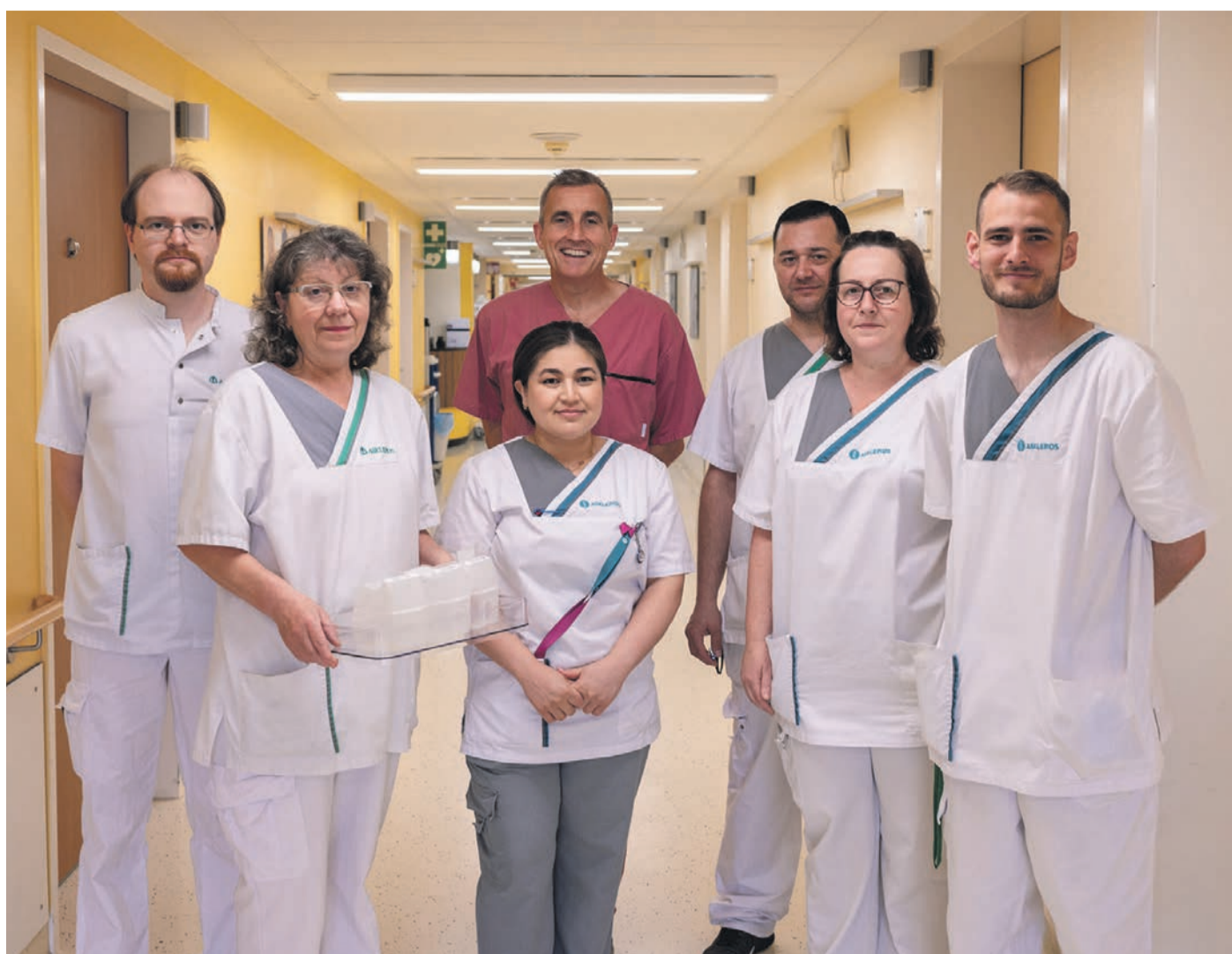
Ein Stationsteam der Asklepios Klinik Langen.

Die Asklepios Klinik Langen folgt mit der Einführung dieses komplexen Systems frühzeitig der Strategie, die das Bundesministerium für Gesundheit im „Aktionsplan AMTS“ (Arzneimitteltherapiesicherheit) zusammengefasst hat. Dort wird Unit Dose in Kombination mit der elektronischen Do-