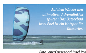
Auf dem Wasser den ultimativen Adrenalinkick spüren: Das Ostseebad Insel Poel ist ein Hotspot für Kitesurfer.

Meer erleben! – Das Ostseebad Insel Poel ist ein Hotspot für Wassersportler (epr) In die Berge oder ans Meer? Für Badenixen und Wassermänner stellt sich diese Frage erst gar nicht! Sie werden magisch von rauschenden Wellen angezogen, die an den Strand rollen – egal ob an der Küste oder auf