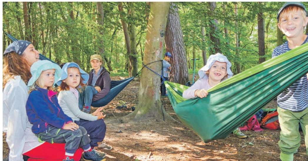
Betreuerinnen und Kinder der Lämmerspieler Waldkita-Gruppe „Die wilden Rehkids“ der AWO Obertshausen beim freien Spiel am Klangwaldplatz.

Weitere Infos über die Lämmerspieler Waldkita-Gruppe „Die wilden Rehkids“ sowie die freien Plätze gibt es bei der AWO Obertshausen, Birkenwaldstraße 38. Telefon: 06104 95364436.