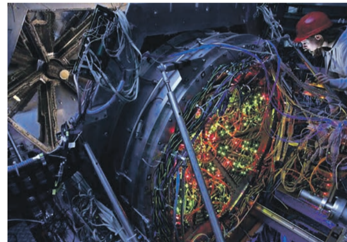
HADES-Detektor bei GSIFAIR, Darmstadt

Energie ist die Basis für die Industrie und somit, gestern wie heute, maßgeblich für die Entwicklung und Ausgestaltung der Kultur- und Industrieland-