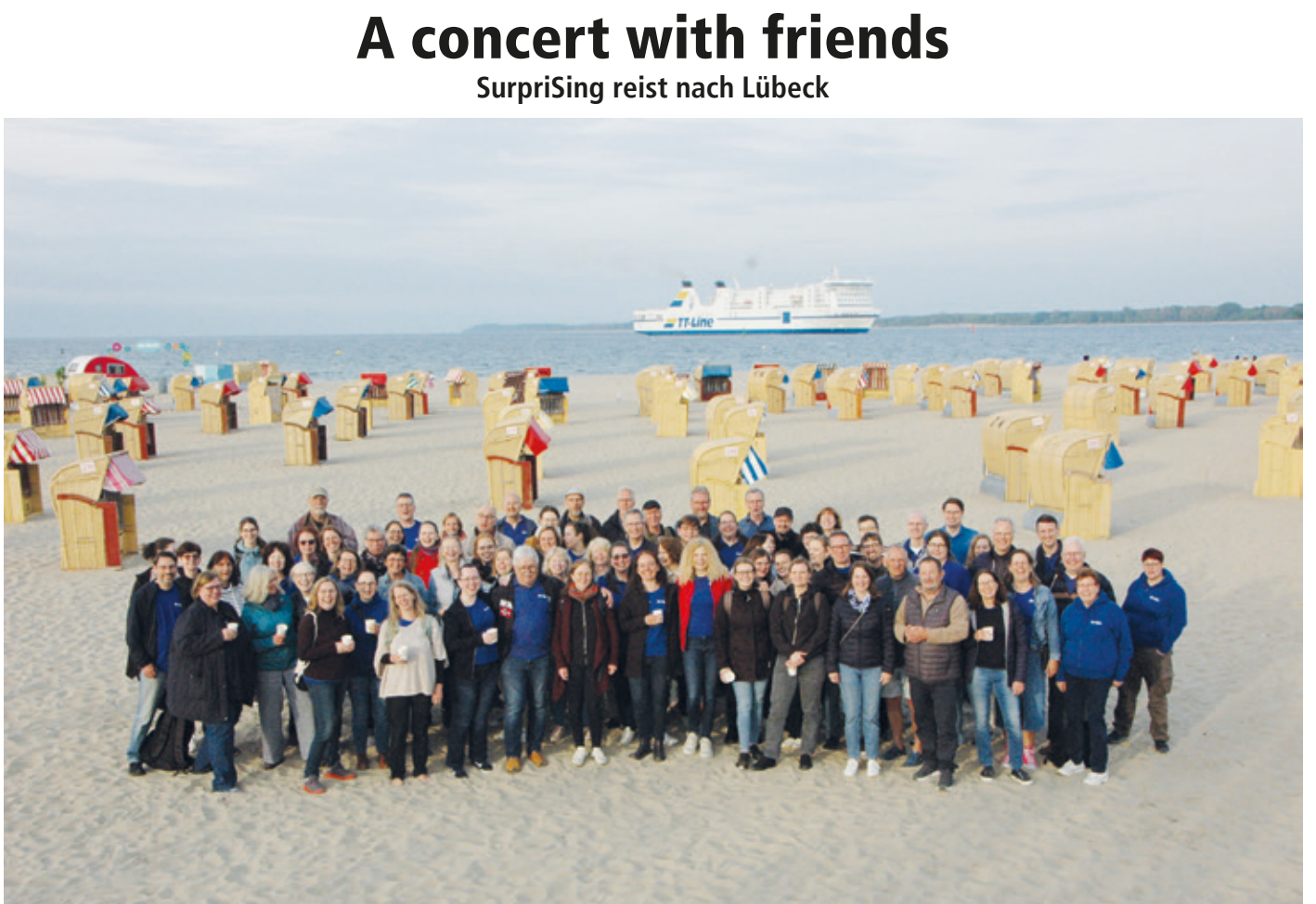
SurpriSing und Baltic Jazz Singers am Strand von Travemünde.