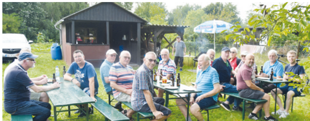
Ein Teil der Sänger vor der Gartenhütte.