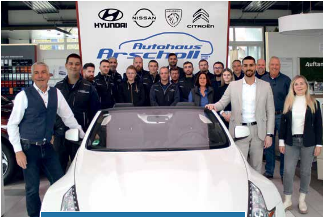
Das Team vom Autohaus Arscholl.

15 Jahre Autohaus Arscholl in Groß Gerau