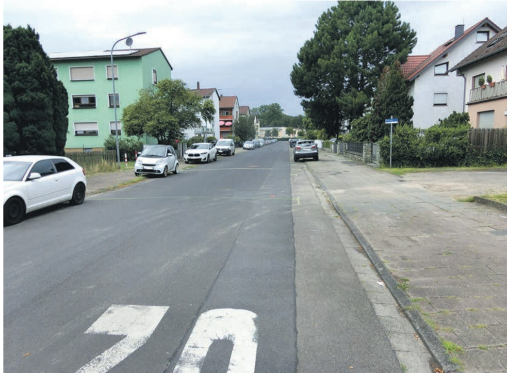
Die Markierungen für die grundlegende Sanierung sind schon deutlich zu sehen. Bald beginnt die Baumaßnahme in der Gumbertseestraße.

Für diese Zeit ist eine Vollsperrung der Straße erforderlich. Zudem sind die anliegenden Häuser nur fußläufig zu erreichen. Die Umleitung erfolgt über die Adenauerstraße und die Taunusstraße. Ebenfalls ist eine Umleitung für Fußgängerinnen und Fußgänger über die Adenauerstraße ausgeschildert. Im Laufe der Baumaßnahme ist der punktuelle Einsatz einer Baustellenampel im Bereich Brückenstraße notwendig.