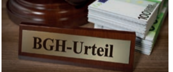
Starkes Urteil für Versicherte.

sind viele Versicherungsverträge auch heute noch anfechtbar. Man nennt dies „ewiges Widerrufsrecht“. Bei einem Widerruf erhalten Sie, anders als bei der Kündigung, alle eingezahlten Beiträge ohne Abzug von Maklerprovisionen und Verwaltungskosten zurück. Ob Ihr Vertrag betroffen ist, prüft zum Beispiel das Düsseldorfer Verbraucherportal helpcheck.de gratis und unverbindlich für Sie. Die Prüfung erfolgt auf Basis Hunderte Urteile datenbankgestützt und individuell durch spezialisierte Anwälte. Sie werden nach der Vertragsprüfung beraten und können das Unternehmen, sofern Sie wünschen, rein auf Erfolgsbasis mit der Durchsetzung Ihres Anspruchs beauftragen. Das bedeutet für Sie: Sie können nur gewinnen, da Sie nur einen Anteil des für Sie bei Ihrer Versicherung erzielten finanziellen Mehrwertes an das Verbraucherportal bezahlen. Ein fairer Deal, denn das Geld, das Sie ohnehin von der Versicherung erhalten hätten, bleibt komplett unangestastet. Das Unternehmen hat bereits über 50 Millionen Euro an seine Kunden ausbezahlt. Die gratis Vertragsprüfung finden Sie hier: www.helpcheck.de/auszahlung