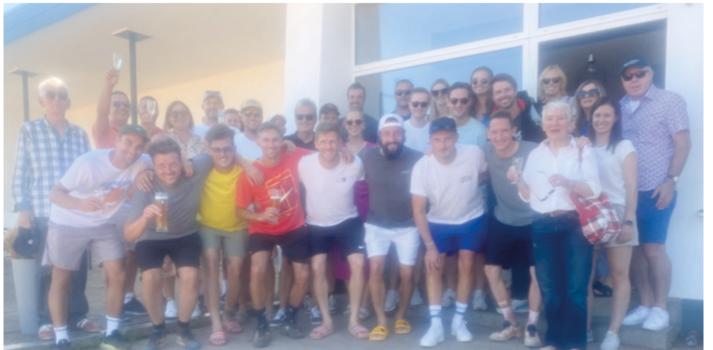
Trotz verpasstem Aufstieg herrschte beste Laune bei den Herren 30 der SGA und den Arheilger Fans.

Tennis-Herren 30 der SGA verlieren in Neunkirchen trotz großer Unterstützung