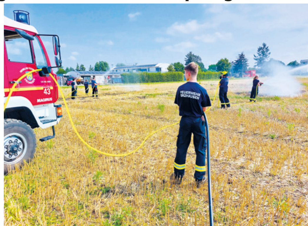
Erzhäuser Feuerwehrkräfte beim Üben des Pump-and-Roll-Verfahrens.

Erzhäuser (kr). Am vergangenen Samstag fand für die Einsatzkräfte der Freiwilligen Feuerwehr Erzhäuser eine Zusatzausbildung zum Thema Vegetationsbrandbekämpfung statt. Durch unseren Kameraden der Ehrenabteilung Holger Tänzer wurde wie bereits im letzten Jahr eine abgeerntete Ackerfläche zur Verfügung gestellt. Dort konnte in einem kleinen, kontrollierten Bereich eine Realbrandbekämpfung durchgeführt werden. Während letztes Jahr durch Regen kein Brand zustande kam, konnten dieses Jahr immerhin kleinere Flächen der auf dem Acker verbliebenen Halme entzündet werden. So konnten das Anlegen von Schneisen mit Gorgui (einem Multifunktionswerkzeug zur Bodenbearbeitung), Wiedehopfhacke und Schaufel, das Auswischen von Flammen mit einer Feuerpatsche und das Pump-and-Roll-Verfahren, bei dem sich ein Löschfahrzeug bewegt und gleichzeitig Löschwasser auf den Brand abgibt, geübt werden. Im Anschluss an die Übung wurden die Wassertanks der Fahrzeuge befüllt