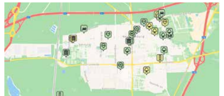
Karte des Onlinemelders auf der Website.