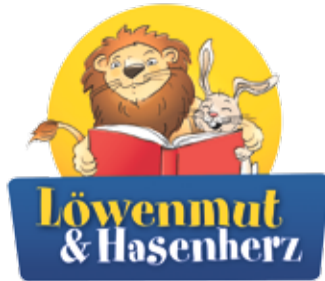
Kleine Menschen entdecken große Geschichten. Logo „Löwenmut & Hasenherz. Große Geschichte für kleine Menschen“.

sind Kinder und Jugendliche. Mit der Aktion setzt die Stadtbücherei einen starken Akzent auf die frühe Leseförderung, die ein elementarer Baustein für eine erfolgreiche Bildungsbiografie ist. Fünf Frankfurter Lions Clubs – Mainmetropole, Römer, Goethestadt, Palmengarten und Paulskirche – finanzieren die stadtweite Aktion. Sie nehmen die Ergebnisse der aktuellen IGLU-Studie zum Anlass für ihr Engagement. Die Studie hält