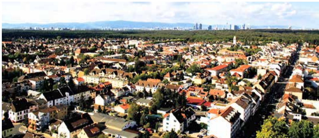
Neu-Isenburg von oben.

Alle Meldungen können auf der Karte mit Ampelstatus zur Bearbeitung eingesehen werden. Sie möchten eine Meldung machen? Hier finden Sie die Website: neu-isenburg.maemeld.de