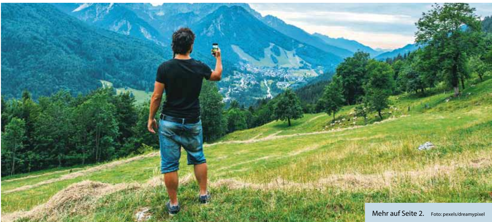
Mehr auf Seite 2.