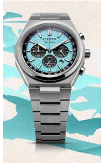
Im Zeichen des Zenshin: Uhren aus Super-Titan sind noch robuster und widerstandsfähiger als ihre Vorgängermodelle.

schon vor über 50 Jahren hatte die japanische Traditionsmarke die erste Uhr der Welt aus diesem besonders widerstandsfähigen und leichten Metall vorgestellt. Die elf neuen Uhren – darunter drei Eco-Drive-Modelle und vier Automatik-Modelle – bestehen nun aus Super-Titanium und sind deshalb noch robuster und langlebiger, alle Infos und Bezugsmöglichkeiten gibt es unter www.citizenwatch.de . Beim Retro-Design der insgesamt drei neuen Modellreihen hat sich der Hersteller von Uhren aus der eigenen Historie inspirieren lassen. Vintage-Uhren der 80er-Jahre standen hier vor allem für die Gehäuseformen und integrierten Bänder Pate. Die Zifferblätter greifen das Thema Titanium auf und deuten die kristalline Struktur des unbehandelten Metalls an. Die Uhren sind mit kratzfestem Saphirglas ausgestattet, bis 10 Bar (100 Meter) wasserdicht und haben einen Durchmesser von 42 Millimetern.