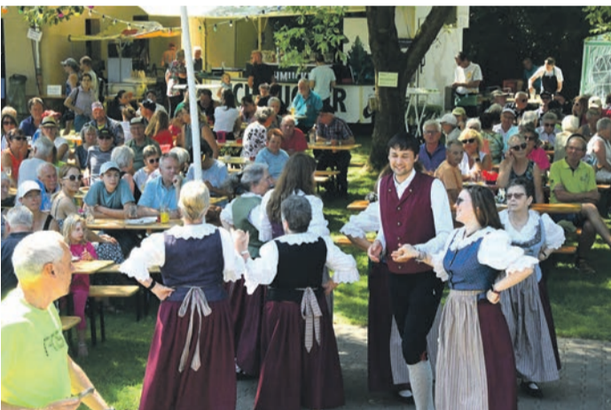
Auch ein Auftritt der Volkstanz-Gruppe der Wandergesellschaft Frisch-Auf gehörte am Sonntag zum Programm des Fests im Biergarten des Wanderheims.