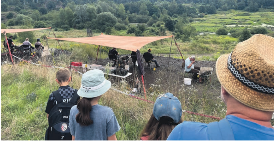
Heusenstammer Kinder besuchen die Grube Messel.

Die Sommerferienspiele der städtischen Kinder- und Jugendförderung finden jedes Jahr in den ersten drei Ferienwochen statt. Das umfangreiche Programm bietet immer viel Abwechslung und Spaß für die Sieben- (ab Vollendung der ersten Klasse) bis Zwölfjährigen aus Heusenstamm und Rembrücken. In diesem Jahr wurden unter anderem ein Bogenschießen-Workshop, eine exklusive Kinovorstellung in Rodgau sowie verschiedene künstlerische und sportliche Aktivitäten angeboten.