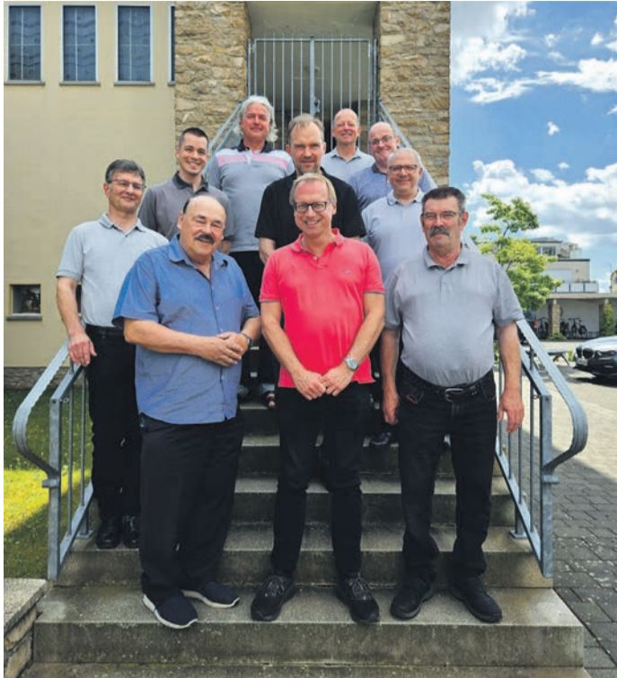
Die Männerschola freut sich immer über neue Sänger.

Neue Sänger sind immer herzlich willkommen.