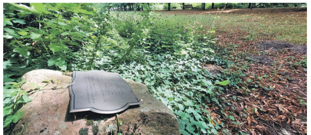
Der Gedenkstein zum Fliegerabsturz in der Schlossallee.

gruppen eingesetzt. Also selbst bei Kindern ab zwei Jahren, bei Schwangeren oder bei Menschen unter Dauermedikation. Gut zu wissen, dass die Natur solch umfassend einsetzbare Schätze bereithält.