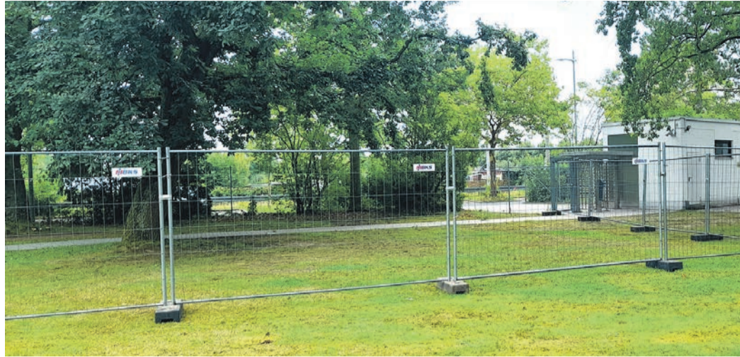
Gesperrter Liegeflächenbereich im Schwimmbad-Außengelände.

Einige Äste konnten direkt vor Ort eingekürzt werden, um die Gefahr weiterer Astbrüche zu verringern. Ein hier bebrütetes Taubennest verhindert allerdings, dass der Baum weiter bearbeitet werden darf. Bis zum Abschluss der weiteren Begut-