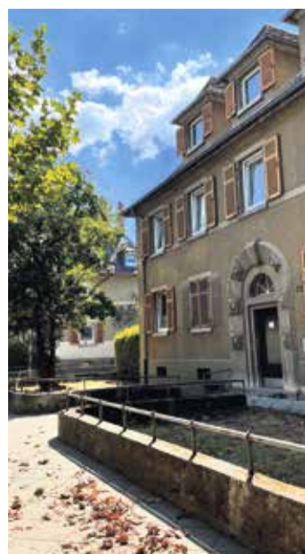
Typisch für diese Wohngegend sind die Gärten an der Vorderseite der Häuser.

Ein besonderes Merkmal Riederwalds sind die Straßennamen, die vor allem nach bekannten Nationalökonominnen und Pionieren der Genossenschaftsbewegung benannt sind. Im ältesten Teil des Stadtteils finden sich Namen wie Raiffeisen-, Schulze-Delitzsch- und Dunckerstraße. Diese Straßen ehren bedeutende Persönlichkeiten, die zur Entwicklung der Genossenschaftsbewegung beigetragen haben. Im östlichen Teil des Stadtteils, wo die kommunale Wohnungsgesellschaft AGB aktiv war, dominieren Namen von Volkswirtschaftlern und Wirtschaftswissenschaftlern wie Karl-Marx-, Friedrich-List- und Thünenstraße. Eine besondere Erwähnung verdient die Umbenennung des Schulze-Delitzsch-Platzes in Johanna-Tesch-Platz. Johanna Tesch, eine engagierte Sozialreformerin und Gewerkschafterin,