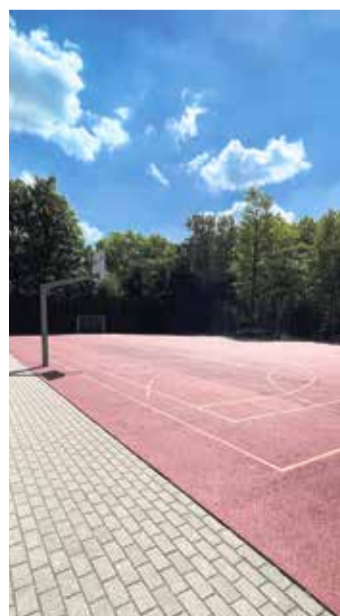
Das frei zugängliche Sportgelände an der Schöfflestraße.

Die Riederhöfe, erstmals 1193 als „Curtis in Riederin“ erwähnt, sind ein weiteres historisches Highlight. Ursprünglich im königlichen Besitz und später von Klöstern verwaltet, gelangten sie im 13. Jahrhundert in den Besitz Frankfurter Patrizier. Diese bauten die Höfe zu wehrhaften Anlagen der Frankfurter Landwehr aus. Im 20. Jahrhundert gehörte ein romantisches Herrenhaus zu den Riederhöfen, das jedoch 1944 zerstört und nach dem Krieg abgerissen wurde. Heute erinnert nur noch das gotische Torgebäude an der Hanauer Landstraße an die einstige Hofanlage, ein stilles Zeugnis der reichen Geschichte dieses Ortes.