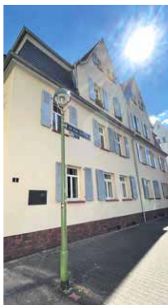
Das ehemalige Wohnhaus der Sozialdemokratin und Reichstagsabgeordneten Johanna Tesch.

Ein Highlight des Stadtteils ist die Schöfflestraße, die mit ihrem expressionistischen Stil und dem alten Torhaus beeindruckt. Tritt man durch den Torbogen, wird es sofort ruhig und man findet sich in einer Oase der Beschaulichkeit wieder. Dieses architektonische Meisterwerk bildet einen der Hauptzugänge zum Riederwald und verleiht der Umgebung einen besonderen Charme. Die