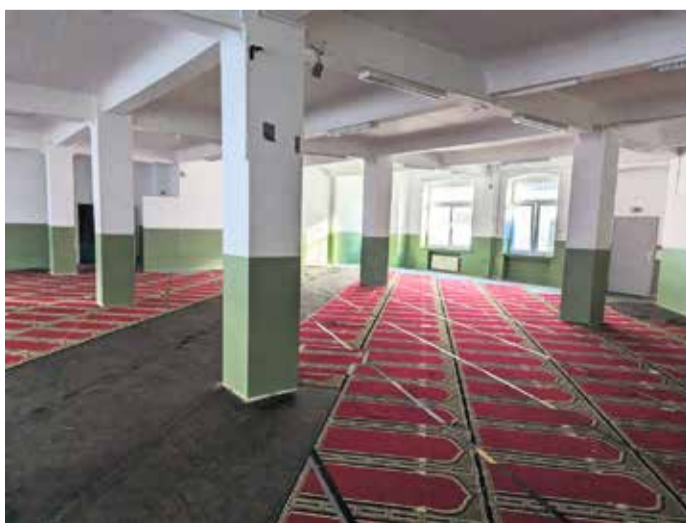
Innenräume vor dem Umbau.