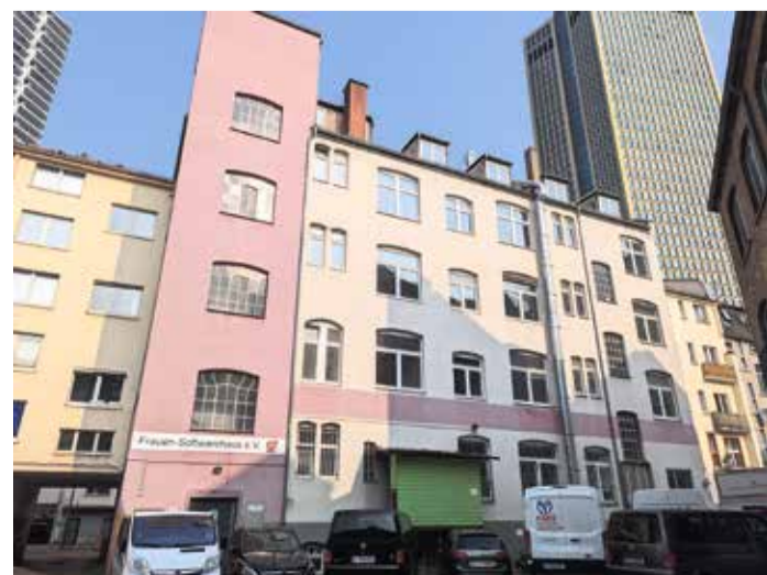
Außenansicht des Gebäudes.

Gebäude in seiner bestehenden Form wieder zu reaktivieren. „R A D A R“ vermittelt als Leerstandsagentur im Auftrag des Stadtplanungsamtes und in Zusammenarbeit mit dem Kulturamt und der Wirtschaftsförderung Frankfurt Gewerberäume an Unternehmen der Kultur- und Kreativwirtschaft, organisiert projektbezogene Zwischennutzungen, informiert über Fördermöglichkeiten, begleitet Anträge und trägt damit zur Stärkung der Stadtentwicklung und kulturellen Vielfalt Frankfurts bei.