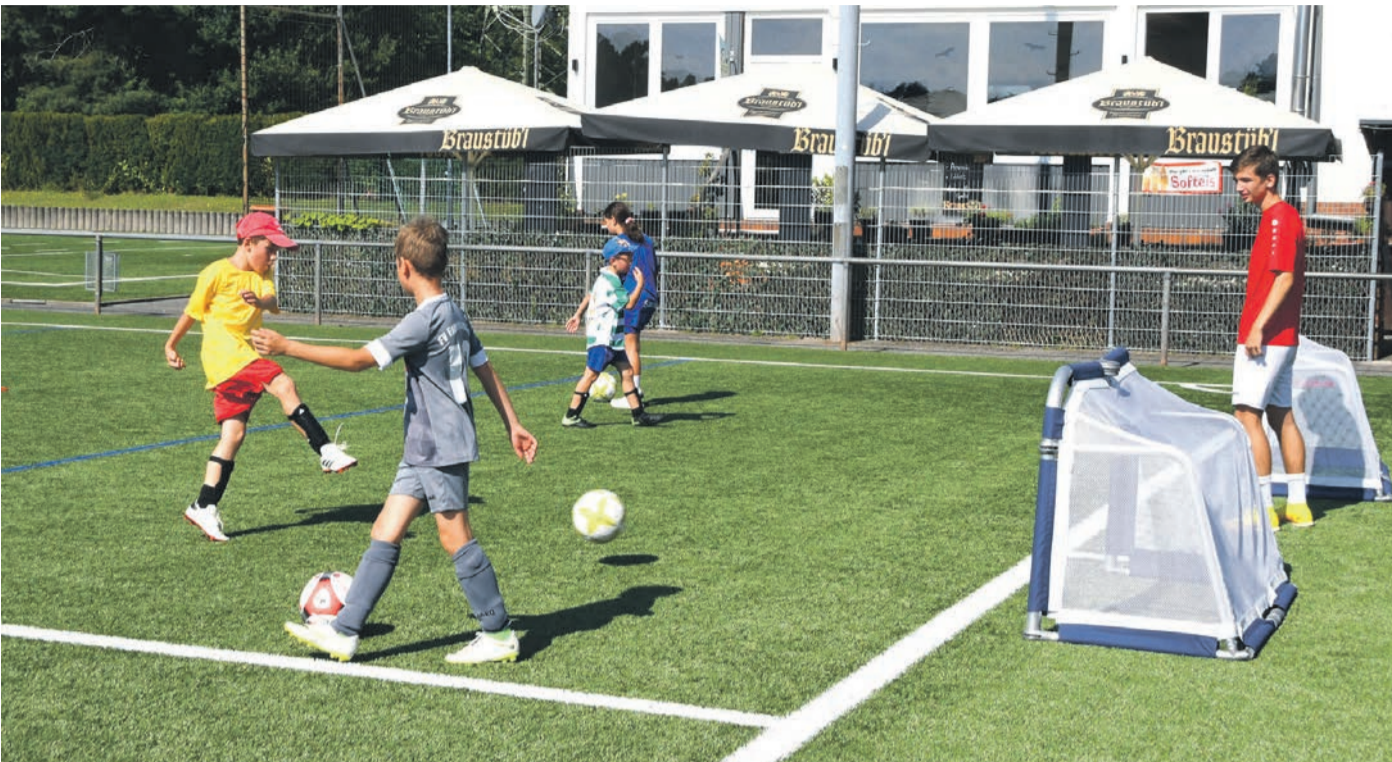
Eins von 16 Angeboten der diesjährigen Eppertshäuser Ferienfreizeit war der Fußball-Tag des FVE im Sportzentrum.

Amtsverkündigungsblatt der Gemeinde Eppertshausen