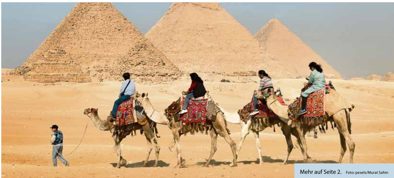
Mehr auf Seite 2.