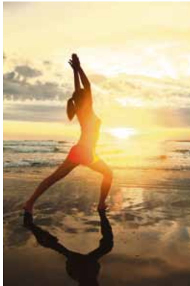
In einem stressigen Alltag werden Meditations- und Yogareisen immer beliebter.

(DJD-K). In einem stressigen und oftmals belastenden Alltag werden Themen wie Achtsamkeit, Wohlbefinden und Selbstfindung in der Gesellschaft immer wichtiger. Das schlägt sich auch im Tourismus nieder. In einer von Statista veröffentlichten Umfrage gaben im Jahr 2022 beispielsweise 36 Prozent der befragten Reisenden aus Deutschland an, dass sie sich vorstellen könnten, eine Meditations- und Achtsamkeitsreise zu unternehmen. Für viele andere Menschen gehört im Urlaub Yoga dazu, um Ruhe zu finden. Auch dazu veröffentlichte Statista eine Umfrage: 13 Prozent der befragten Frauen gaben an, im Urlaub gerne Yoga auszuüben. Auf dem Reisemarkt haben Meditations- und Yogareisen deshalb stark an Bedeutung gewonnen, eine besondere Zielgruppe sind dabei Alleinreisende. Sie befinden sich im Urlaub in der Gesellschaft von Menschen, die ihre Neugier und Leidenschaft fürs Meditieren oder für Yoga teilen.