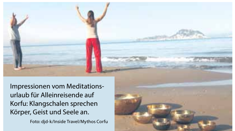
Impressionen vom Meditationsurlaub für Alleinreisende auf Korfu: Klangschalen sprechen Körper, Geist und Seele an.

Meditieren oder für Yoga teilen. Der Spezialveranstalter Inside Travel etwa hat Meditations-, Kreativ- und Yogareisen für Alleinreisende im Programm. Die Urlaubszentren liegen in Strandnähe und dennoch weit entfernt vom Massentourismus. Besonders beliebt für eine entspannende Auszeit sind zwei Anlagen auf der griechischen Ferieninsel Korfu, unter www.inside-travel.com findet man alle Infos.