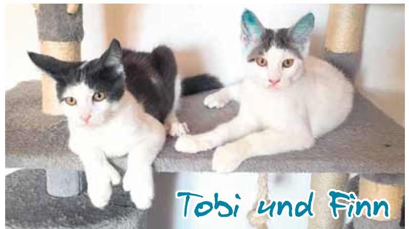
Tobi und Finn

TSV SELIGENSTADT (PM). Tobi und Finn sind Brüder und sollen zusammen bleiben. Die zwei Brüder Finn und Tobi sind Abgabe-Katzen aus Großkrotzenburg – 4 Monate alt. Sie verstehen und ergänzen sich so gut, dass sie nur zusammen vermittelt werden. Finn ist der forscherere der beiden, geht auf die Menschen zu und bezaubert einen mit seinem Charme. Er ist ein kleiner Sonnenschein.