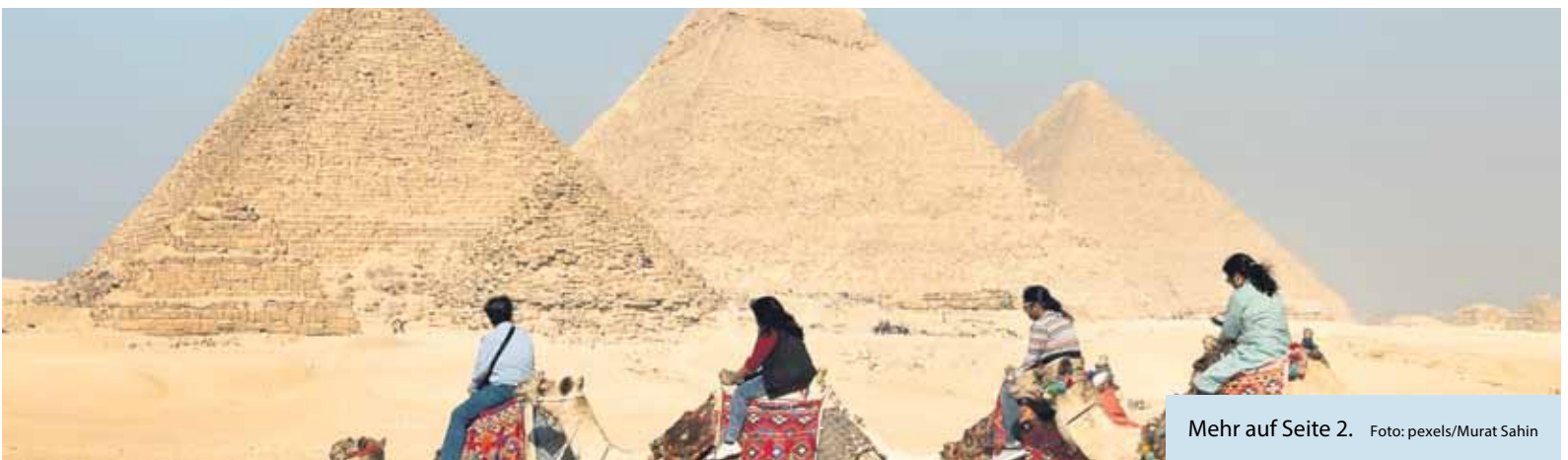
Mehr auf Seite 2.