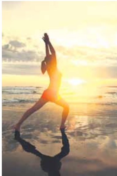
In einem stressigen Alltag werden Meditations- und Yogareisen immer beliebter.

(DJD-K). In einem stressigen und oftmals belastenden Alltag werden Themen wie Achtsamkeit, Wohlbefinden und Selbstfindung in der Gesellschaft immer wichtiger. Das schlägt sich auch im Tourismus nieder. In einer von Statista veröffentlichten Umfrage gaben im Jahr 2022 beispielsweise 36 Prozent der befragten Reisenden aus Deutschland an, dass sie sich vorstellen könnten, eine Meditations- und Achtsamkeitsreise zu unternehmen. Für viele andere Menschen gehört im Urlaub Yoga dazu, um Ruhe zu finden. Auch dazu veröffentlichte Statista eine Umfrage: 13 Prozent der befragten Frauen gaben an, im Urlaub gerne Yoga auszuüben. Auf dem Reisemarkt haben Meditations- und Yogareisen deshalb stark an Bedeutung gewonnen, eine besondere Zielgruppe sind dabei Alleinreisende. Sie befinden sich im Urlaub in der Gesellschaft von Menschen, die ihre Neugier und Leidenschaft fürs Meditieren oder für Yoga teilen.