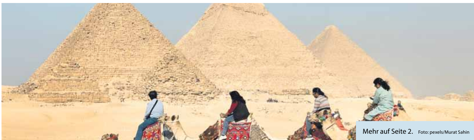
Mehr auf Seite 2.