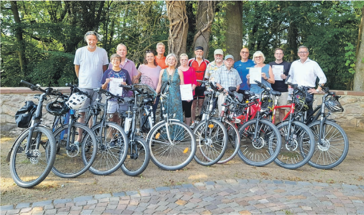
Die Teilnahmeurkunden fürs STADTRADELN 2024 sind überreicht.