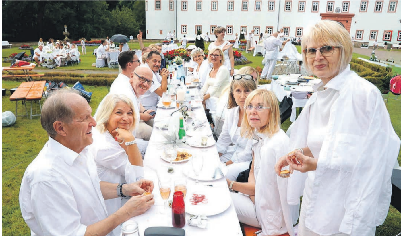
An diesem Abend lautete die Grundregel: Weiß!

Wer am Samstagabend den Schlosspark betrat, der war sofort von der entspannten Atmosphäre gefangen. Wie weiße Tupfer waren die Tische auf dem satten Grün des Schlossparks verteilt. Das Konzept des Weißen Dinners ist ganz einfach – denn an diesem Abend lautet die Grundregel: Weiß! Alle Teilnehmenden waren von Kopf bis Fuß komplett weiß gekleidet sein. Und wie bei einem guten Picknick üblich, haben alle ihre eigenen, mit weißen Tischdecken und