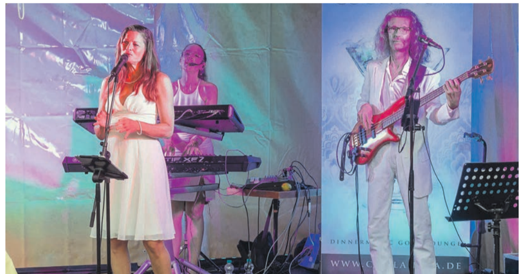
„Coolanova“ sorgten für die musikalische Untermalung.