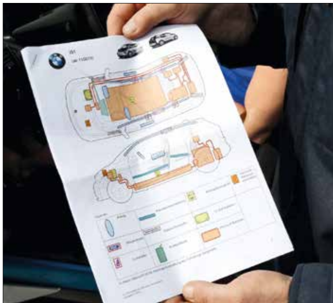
Die Fahrzeugtechnik ist schematisch dargestellt.

Karosseriestrukturen, Sensorik und Pyrotechnik von Airbags und Gurtstraffern werden immer komplexer. Was gut für die Sicherheit der Insassen beim unmittelbaren Unfall ist, wird für Rettungsdienste zu einer immer größeren Hürde.