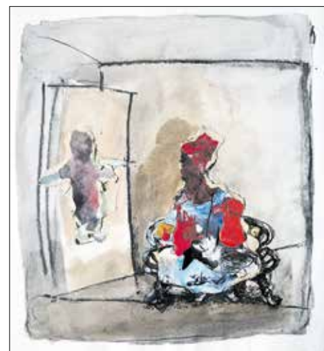
„Aufbruch“, 2004, Tusche, Aquarell, A5