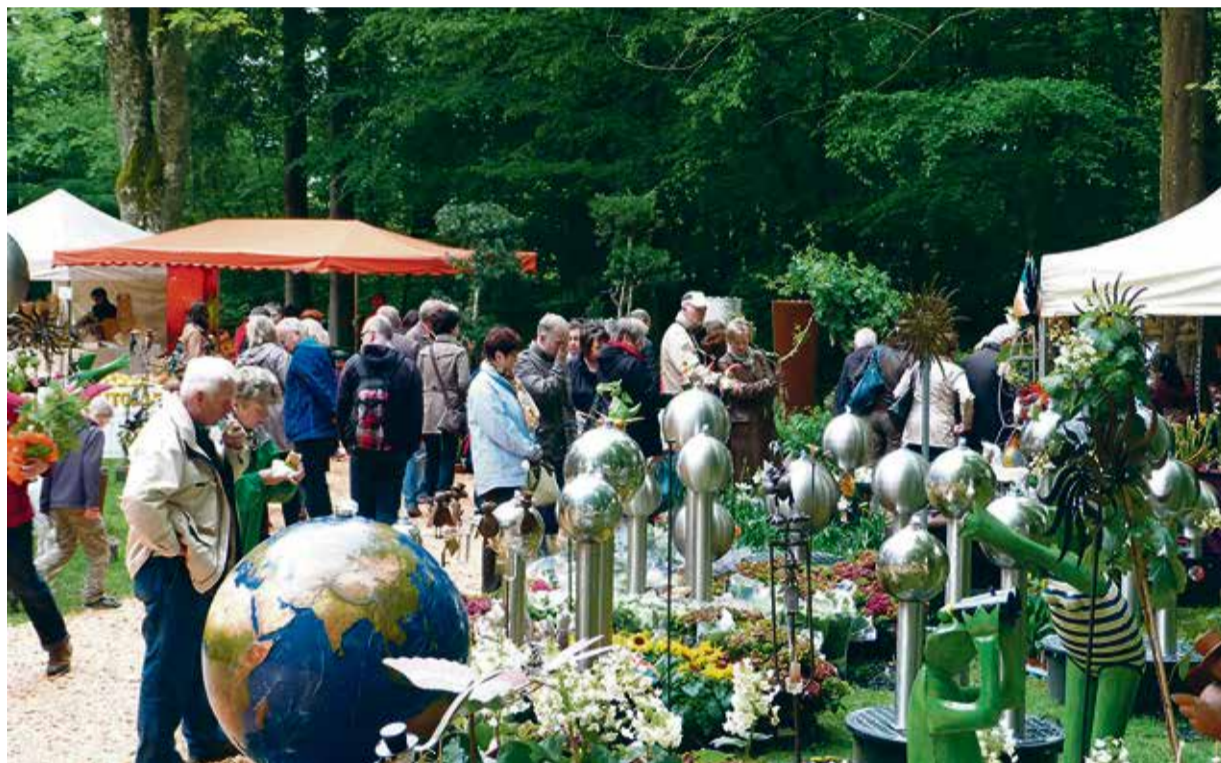
Eine große Bandbreite an Pflanzen und Dekoration für den heimischen Garten gibt es auf der „Odenwald-Country-Fair“ zu sehen.

In Eulbach findet die Gartenmesse „Odenwald-Country-Fair“ statt