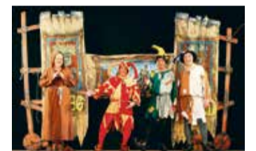
Der Schalk steht ihnen nicht nur ins Gesicht geschrieben, er steht mitten auf der Bühne – Darsteller des Kikeriki-Theaters.