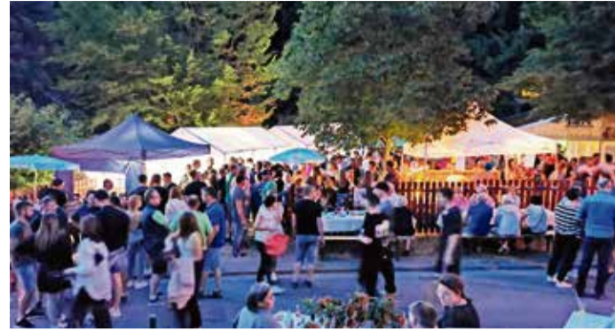
Die Schwimmbadwiese wird zur Festwiese.

KFZ-Ankauf Kaufe gegen bar: Pkws, Busse, Lkws, Geländewagen, Wohnmobile, Pick-Up mit Mängeln u. viele km ohne oder mit TÜV, Motor oder Getriebeschaden, suche auch Agria. Tel. 0177 / 2802695 oder über WhatsApp 24 Std. erreichbar o. per E-Mail: tufan_83@hotmail.de