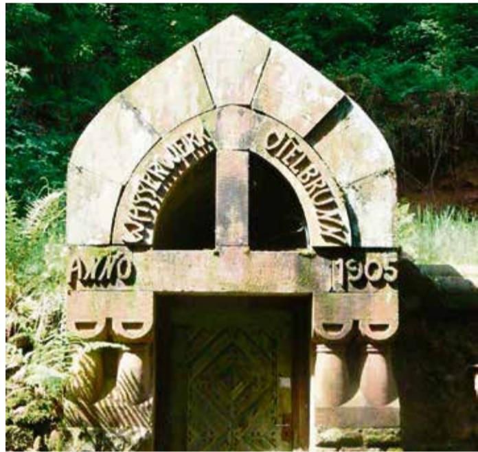
Am Pfingstmontag, 20. Mai, ist anlässlich des Deutschen Mühltags unter anderem das historische Wasserwerk Vielbrunn für Besucherinnen und Besucher geöffnet.