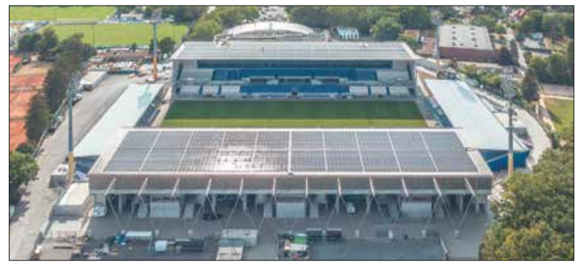
Auf den Dächern der Haupttribüne wurden rund 2.900 PV-Module installiert.

an der PV-Anlage des Stadions am Böllenfalltor