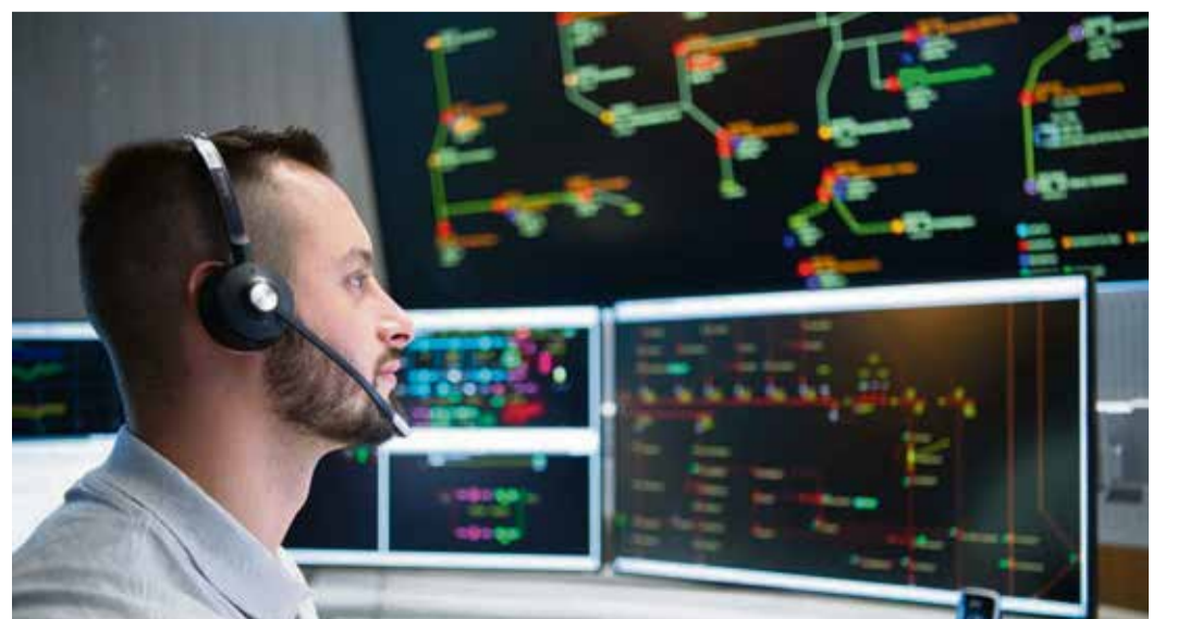
Schaltmeister in der zentralen Leitwarte der E-Netz Südhessen in Darmstadt.