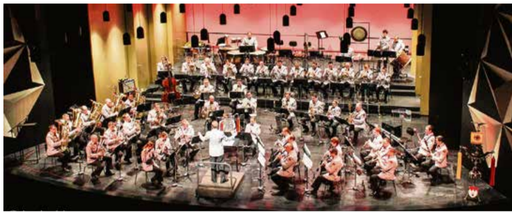
Das international renommierte Heeresmusikkorps Veitshöchheim ist musikalisch vielseitig.