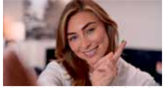
Bekommt man einen Splitter nicht richtig heraus, kann sich ein Eiterherd bilden.

Ganz natürlich geht durch die grüne ilon Salbe classic die Entzündung zurück. Das umliegende Gewebe wird weich. Unliebsame Splitter können schonend entfernt werden.