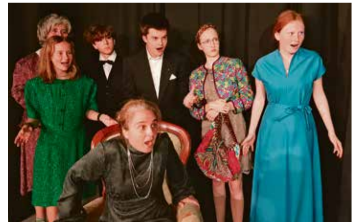
Die Bannoser Jugend im Bühneneinsatz.