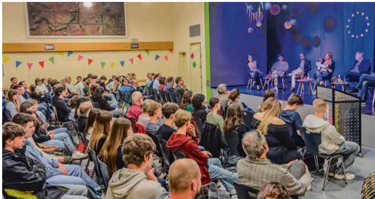
Die Teilnehmer der Paneldiskussion in der vollbesetzten Aula der Reichelsheimer Georg-August-Zinn-Schule.