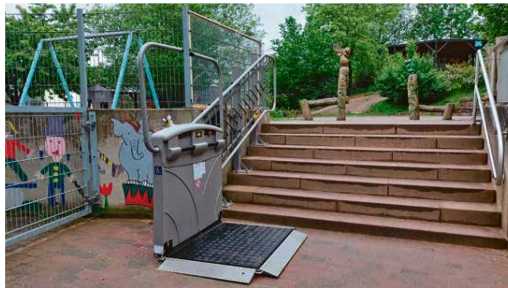
Der neue Plattformlift.