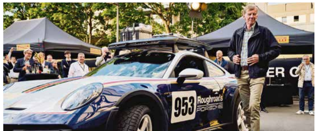
Auch Rallye-Legende Walter Röhrl stattete der Driver-Filiale in Frankfurt anlässlich des 10. Geburtstages einen Besuch ab.