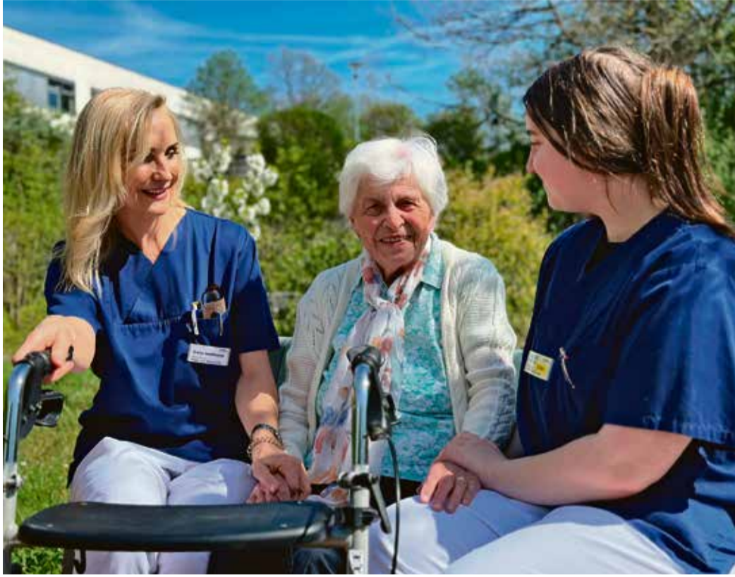
Älteren Menschen nahe sein: Altenpflegehelferinnen und -helfer haben in dieser Arbeit eine wichtige Rolle.

Odenwaldkreis. Der Odenwaldkreis engagiert sich mit einem neuen Ausbildungsangebot für zugewanderte Bürger ohne Schulabschluss, das zugleich alten und pflegebedürftigen Menschen zugutekommt: In zwei Jahren können Interessierte den Hauptschulabschluss erwerben und zeitgleich eine Ausbildung zum Altenpflegehelfer machen. Bei diesem Kurs arbeiten die Kreisverwaltung, das Berufliche Schulzentrum Odenwaldkreis (BSO) und das Gesundheitszentrum Odenwaldkreis (GZO) eng