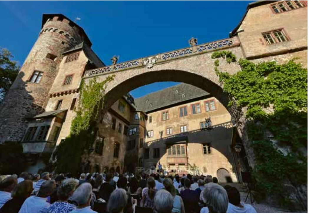
Der Aufführungsort für die Komödie „Dorf ohne Männer“.

Michelstadt. Die Theatergruppe „Vogelfrei“ aus Heidelberg gastiert am Samstag, 29. Juni, im Schlosshof von Schloss Fürstentau in Michelstadt-Steinbach. „Ein Dorf ohne Männer“ lautet der Titel der Komödie von Ödön von Horváth, das um 19 Uhr beginnt. Das Stück spielt im Jahr 1458. Der neu gewählte König von Ungarn und Kroatien, Matthias Corvinus, steht vor vielen Problemen in seinem Reich, denn nicht nur die Korruption, sondern auch der Krieg gegen das Osmanische Reich verschlingt alle Ressourcen. „Ein Dorf ohne Männer“ lautet der Titel der Komödie von Ödön von Horváth, das um 19 Uhr beginnt. Nun soll eine Petition an den neuen König Abhilfe schaffen, jedoch: Ausnahmslos alle Frauen aus Selischtje sind nicht gerade für ihre Schönheit bekannt. Eine handverlesene Delegation von Frauen soll nun den König vom Gegenteil überzeugen. Die Karten sind ab sofort im Vorverkauf für 10 Euro das Stück in der Gästeinformation Michelstadt, Marktplatz 1 erhältlich. Vorbestellungen sind über touristik@michelstadt.de möglich.