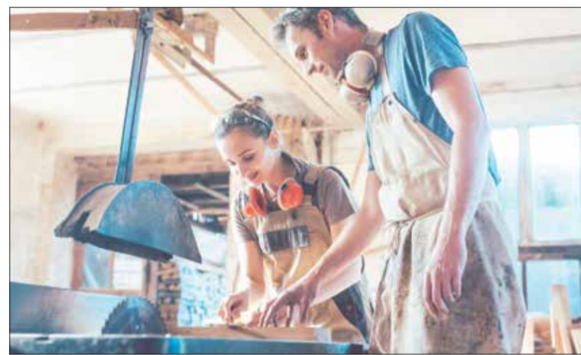
Eine Jugendliche lernt die Arbeit in einem Holzverarbeitenden Betrieb kennen.

Neue Aktion für Schülerinnen und Schüler im Sommer – Anmeldung ab jetzt möglich