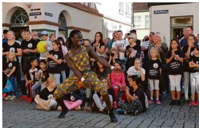
Eine Aufführung zur Interkulturellen Woche.