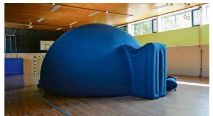
In diesem blauen Zelt befindet sich der „Eingang zu den Sternen“.

Höchst. Ein mobiles Planetarium kam vor kurzem zu Besuch in die Ernst-Göbel-Schule. Die siebten Klassen konnten in einem von einer Odenwälder Firma aufgebauten „Lernarium“ ein kleines Planetariumsprogramm anschauen und ein paar physikalische Experimenten