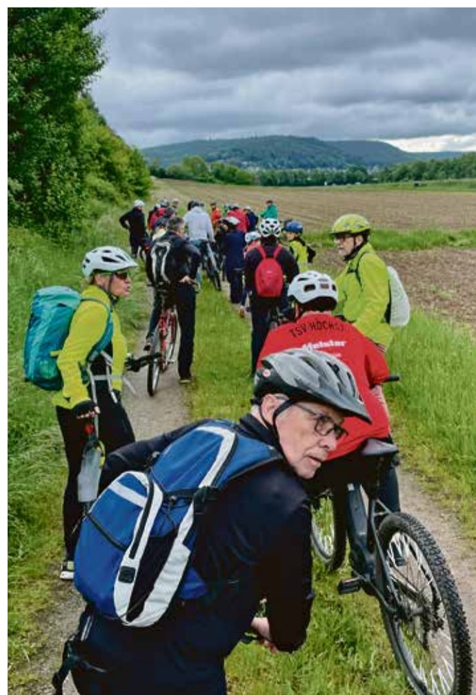
Den trüben Wolken trotzend schwingen sich viele Höchster auf das Rad.