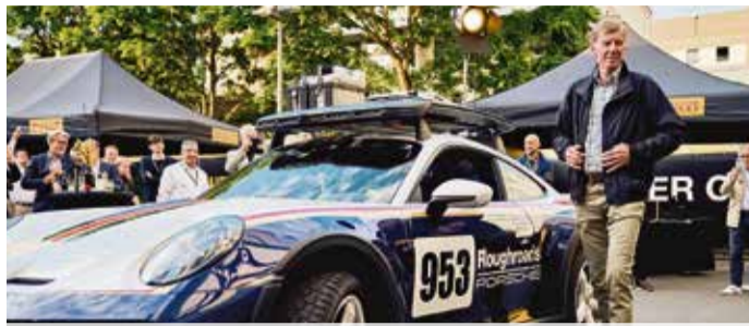
Rallye-Legende Walter Röhrli zu Gast bei Pirelli Seite 8