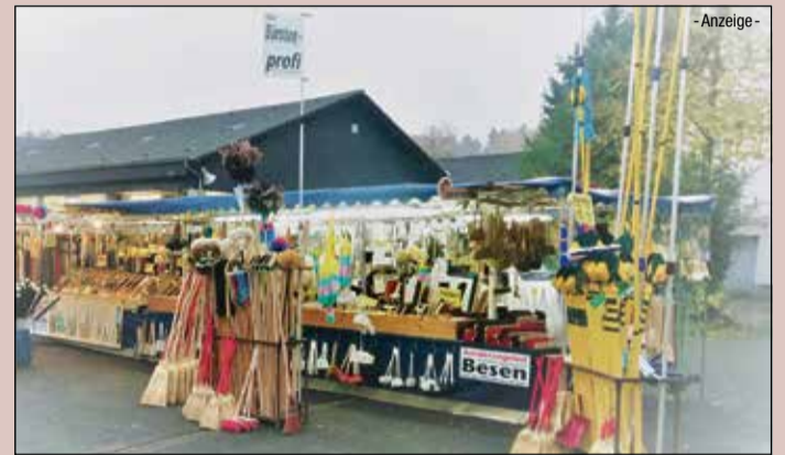
Der Bürstenprofi: Besen & Bürsten für jeden Einsatzbereich, Aluminiumteleskopstangen bis 12 Meter Höhe! Original Solinger & Schweizer Qualitätsschneidewaren. Eine Riesenauswahl an Hosenträger aus eigener Herstellung. Sie finden uns wie jedes Jahr oberhalb vom Festzelt. Wir freuen uns auf ihren Besuch.

Beerfelder Pferdemarkt... ...wo Tradition zum Volksfest wird. Wir sehen uns!