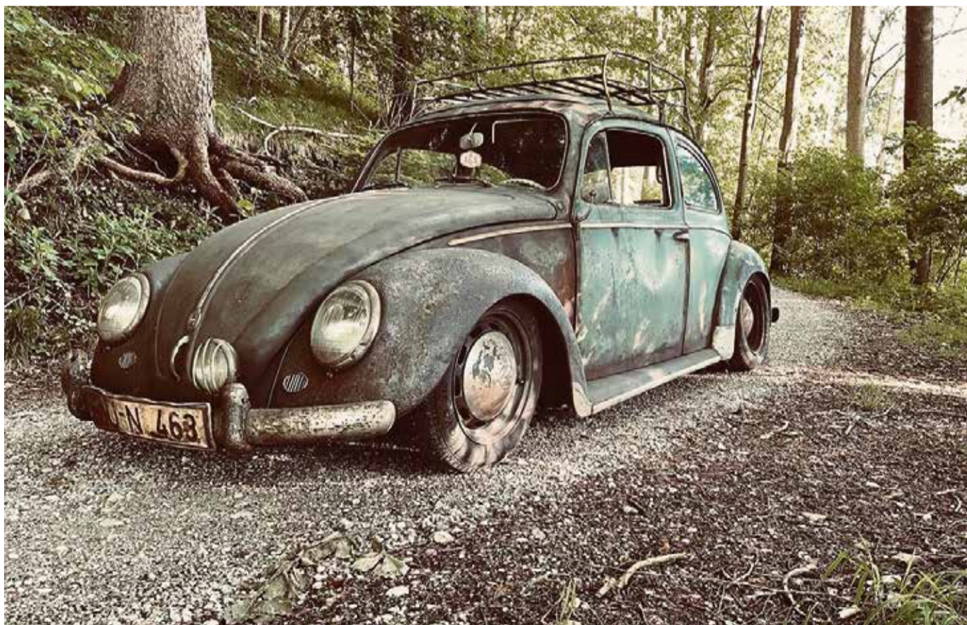
Florian Rauscheder fand im Wald einen alten VW Käfer. Das Fahrzeug ist wieder fahrbereit, hat aber seine Waldpatina noch auf dem Lack.

Klassikerfestival zeigt 120 Jahre Fahrzeuggeschichte