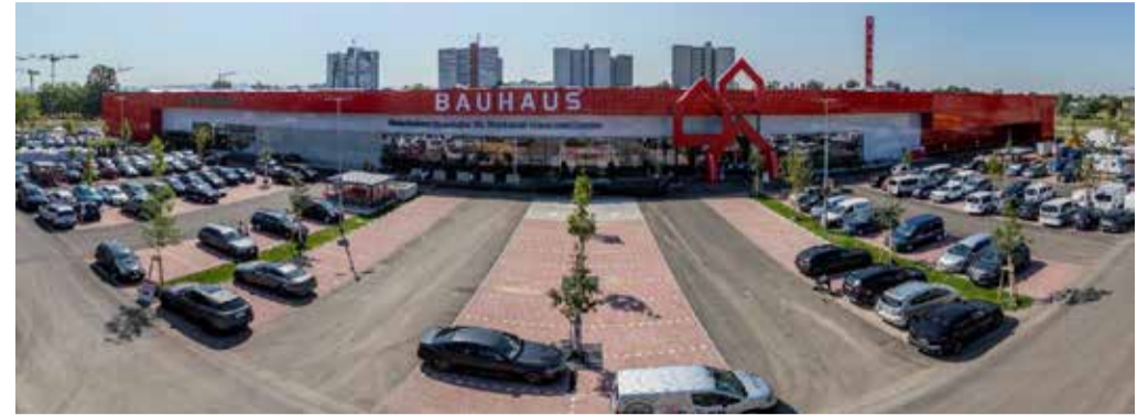
Das neue BAUHAUS bietet reichlich Platz für 160.000 Qualitätsprodukte.

MANNHEIM (SH) Das neue BAUHAUS Fachzentrum in Mannheim-Columbus hat am 28. Juni seine Türen geöffnet und ersetzt somit das kleinere BAUHAUS Vogelstang. Mit rund 19.000 Quadratmetern Fläche bietet es 6.500 Quadratmeter mehr Platz und ein völlig neues Verkaufskonzept. Neben besonderen Services wie der Drive-In ARENA, einer Abholstation und einem Gasflaschenautomat, liegt der Fokus auf Nachhaltigkeit: Schnellladesäulen