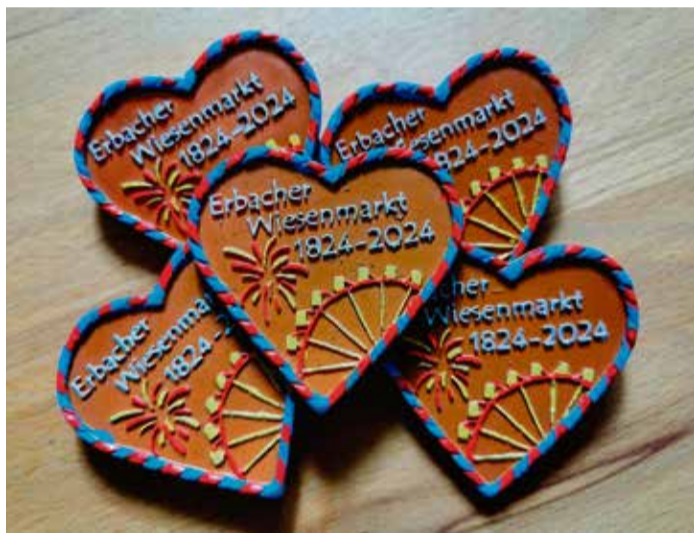
Das Wiesenmarktherz ist längst ein Sammelobjekt geworden und zeigt die Jahre 1824-2024 in denen der Wiesenmarkt in Erbach stattfindet, das Feuerwerk und das Riesenrad.

Erbach. Bereits seit dem Jahr 2010 können Freunde des Erbacher Wiesenmarkts in der Wiesenmarktzeit ein kleines Ansteckerherz erwerben, das immer ein anderes, typisches Festmotiv mit der jeweiligen Jahreszahl zeigt.