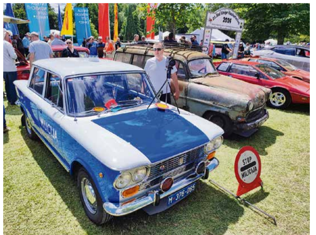
Der Polizeiwagen war ein Eye-Catcher des Festivals.