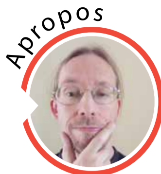
von Sven Iwertowski, Redaktionsleiter