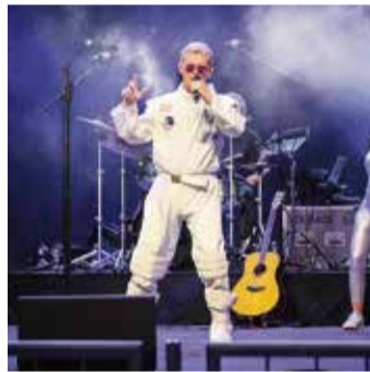
Der hessische Popsänger und NDW-Star Markus bringt eine 80er-Party auf die Bühne.

Liveband und dem „Ich will Spaß“-Showballett. „Die 80er waren schrill und voller Lebensfreude. Und mal ehrlich: Schulterpolster, Vokuh-