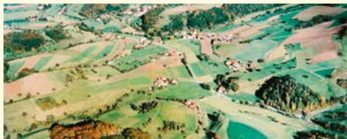
Ober-Ostern aus der Luft.

Unscheinbar sieht Ober-Ostern, Ortsteil von Reichelsheim, aus – doch der Eindruck täuscht: Bereits 880 wurde der Ort als „Osterenaha“, als „nach Osten fließender Bach“ erwähnt, bevor sich daraus dann über mehrere Namen der heutige Begriff herausbildete. Zum Ende des 14. Jahrhunderts, 1398, werden die Schenken von Erbach mit den Rechten an dem Ort belehnt. Da bereits zu diesem Zeitpunkt ein Stein-Zehnter erwähnt wurde, kann auf eine bergbauartige Tätigkeit in der Region geschlossen werden. Auch in den folgenden Jahrhunderten ist der Bergbau, etwa der Abbau von Manganerz, Teil der wirtschaftlichen Tätigkeit in Ober-Ostern, erst in den 1920er Jahren endete der Abbau von Schwespat. Daneben liegt der Schwerpunkt über die Zeit auf der Land-