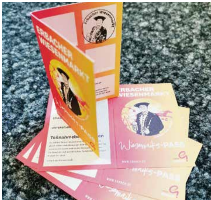
Die Bonuskarte für das Gewinnspiel.

der Erbacher Schlossweihnacht statt. red