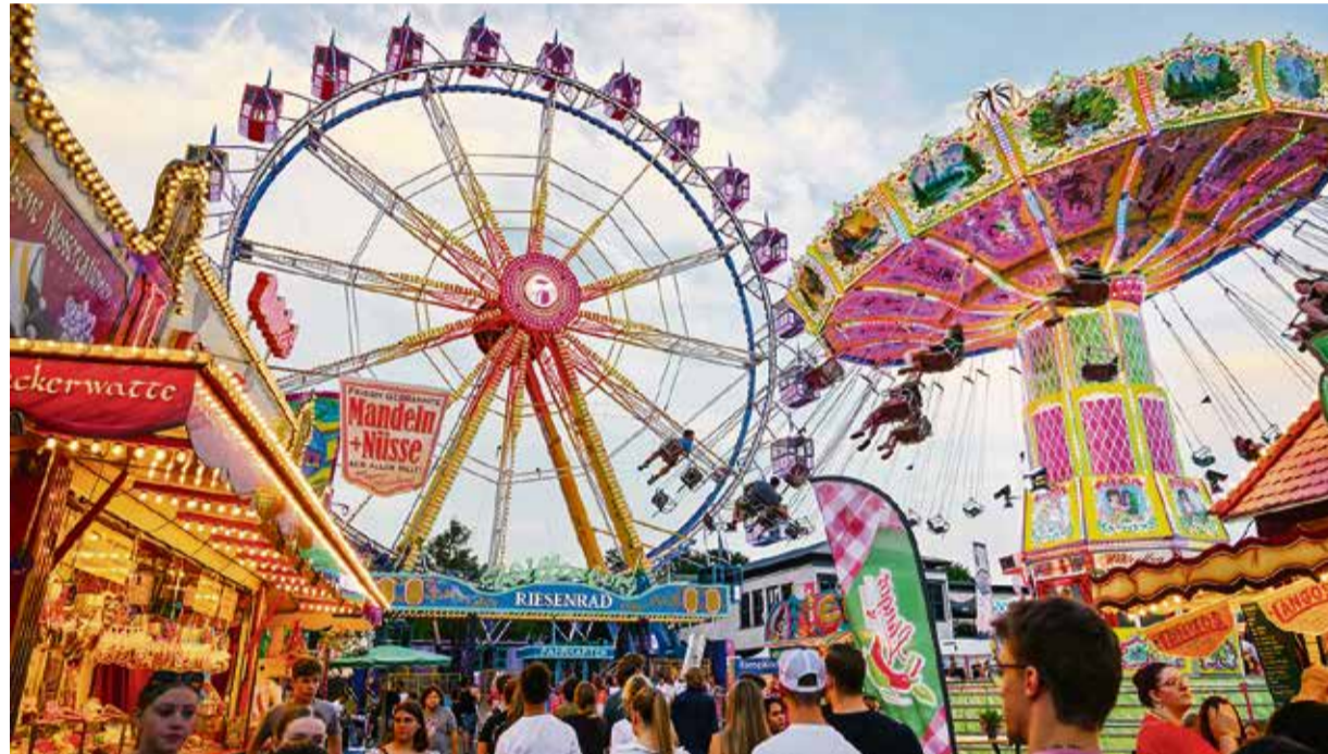
Riesenrad, Lichterzauber und Spaß für Groß und Klein – Der Wiesenmarkt ist eine Institution im Odenwaldkreis.

Erbach. Ende Juli ist es so weit: Der Erbacher Wiesenmarkt öffnet vom Freitag, 19., bis Sonntag, 28. Juli, wieder seine Tore – und feiert dabei ein Jubiläum. Vor genau 200 Jahren zog der „Eulbacher Markt“ von Eulbach auf den Festplatz nach Erbach. War dies zunächst vorübergehend aufgrund des Todes von Stifter Graf Franz I. geplant, ist das heute als „Erbacher Wiesenmarkt“ bekannte Volksfest dauerhaft in der Kreisstadt. Im Rahmen einer Sonderausstellung in der Werner-Borchers-Halle können sich Besucher anhand von Bild- und Textmaterial einen Eindruck über die vergangenen 200 Jahre machen.