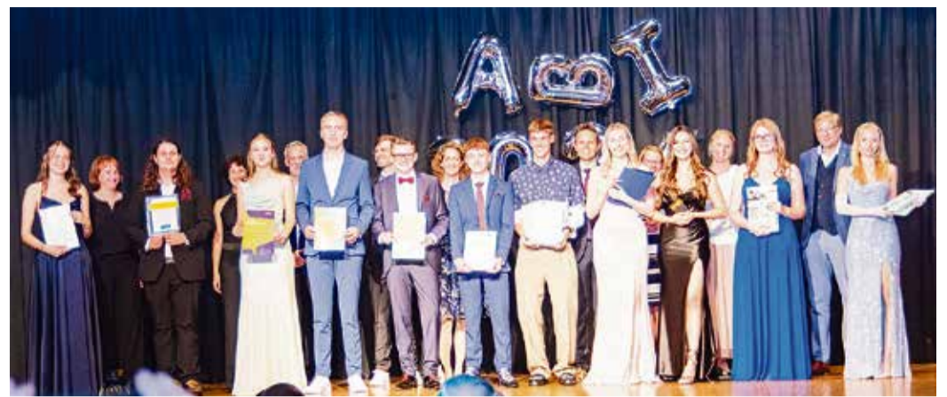
Eine Phase des Lebens abgeschlossen: Abiturienten der Georg-August-Zinn-Schule auf der Bühne.

Abschlussfeier der Georg-August-Zinn-Schule füllt Halle