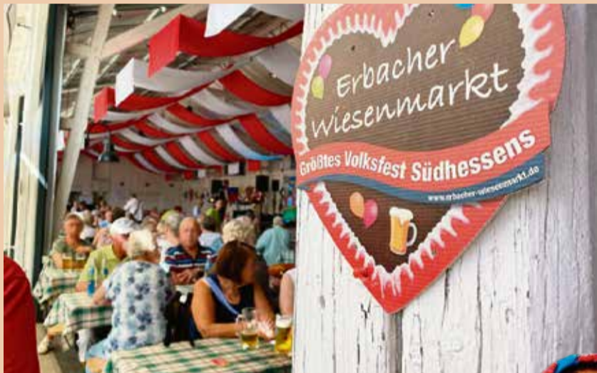
Ein fester Bestandteil des Erbacher Wiesenmarkts: der Seniorenfrühschoppen am Dienstagvormittag.

Als Abschluss sind die Senioren zu einer kostenlosen Fahrt mit dem Riesenrad eingeladen. red