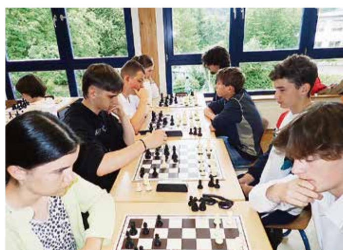
Das königliche Spiel stand in der Ernst-Göbel-Schule auf dem Programm.

Höchst. Vor Kurzem wurde die traditionelle Schulschachmeisterschaft der Ernst-Göbel-Schule mit insgesamt 28 Teilnehmern ausgetragen. Unter der Leitung von Markus Kreh und Thomas Raupach versammelten sich die Spieler zu einem Schachturnier im sogenannten Schweizer System mit einer Bedenkzeit von 10 Minuten pro Spieler und Partie. Insgesamt wurden sieben Runden gespielt, wobei die Turnierfavoriten vor allem die drei Spieler und Spielerinnen des SC Groß-Umstadt waren, die ihrer Favoritenrolle aber nur bedingt