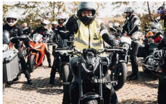
Fahrt für den guten Zweck - vor Kurzem waren die Frauen mit „SheRIDes“ an der Reihe.

Spendenscheck während der Abschlusskundgebung in der Burg in Empfang nehmen. Die Gründerin des Odenwälder Vereins ist Betroffene aus eigener Erfahrung und hilft Frauen und Männern bei der Bewältigung und im Umgang mit Gewalt in Beziehungen. Der Demonstrationszug wurde von der Polizei Südhessen und den Kradstaffeln des DRK Odenwaldkreis e.V. und des DRK Dieburg e.V. begleitet