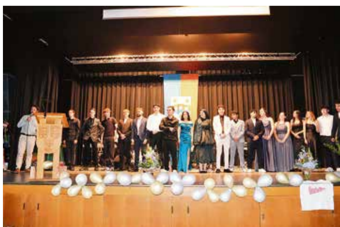
Ein stolzer Moment für die Abgänger der Ernst-Göbel-Schule (hier die Klasse R10b).