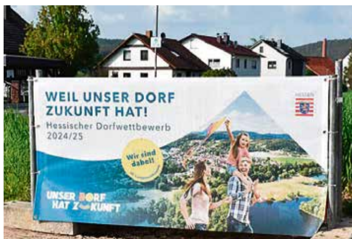
Gut sichtbar: Der Höchster Ortsteil Dusenbach hat das Wettbewerbsbanner des Dorf Wettbewerbs am Ortseingang platziert.

Für den Oberzenter Stadtteil Ober-Hainbrunn freut sich auch Ortsvorsteher Stefan Hofmann über die Auszeichnung. Die Verantwortlichen bezeichnen ihren Ort selbst als „Infrastrukturort“. Hier wird viel selbst angepackt, sei es beim Bau des Feuerwehrhauses, bei der Renovierung und Sanierung des Schulhauses oder kürzlich bei den Festlichkeiten zur 675-Jahr-Feier. In Dusenbach, das zur Gemeinde Höchst gehört, gibt es eine ganz beson-