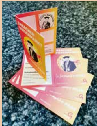
Die Bonuskarte für das Gewinnspiel.

gegangenen meistgestempelten Karten werden drei Gewinner ausgelost. Zu gewinnen gibt es verschiedene Merchandising Pakete. Der Hauptgewinn umfasst eine Komplettausstattung der neuen Merchandising-Serie, bestehend aus T-Shirt, Cap, Tasche, Aufkleber und dem Wiesenmarkt-Herz. Die Preisverleihung findet im Rahmen der Eröffnung der Erbacher Schlossweihnacht statt.