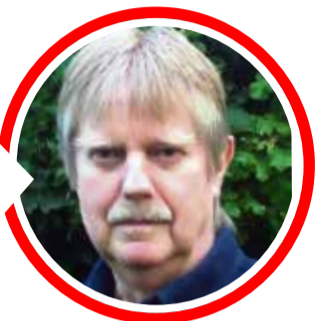
von Dr. Detlef Eichberg

durch zahlreiche klinische Studien hinsichtlich seiner antisklerotischen Eigenschaften bestens bestätigt worden. Das heißt, dass Knoblauch in der Tat einer mit zunehmendem Alter fortschreitenden „Verkalkung“ unseres Gefäß-Systems vorbeugt, indem er die negative Cholesterin- und Blutfett-Wirkung mindert. Des Weiteren verbessert Knoblauch die Fließeigenschaften des Blutes, indem die Neigung zum Verklumpen der Blutplättchen (Thrombozyten) herab gesetzt wird. Schließlich wirken Senföle im Knoblauch antiparasitär. Dies kann auch unseren Haustieren zugute kommen, wenn die tägliche Gabe einer Knoblauchzehe Würmern und sonstigen Parasiten zu Leibe rückt. Hinsichtlich etwaig negativer Aspekte bleibt nur eine Nebenwirkung zu berichten: Knoblauch riecht nach dem Verzehr aus allen Poren.