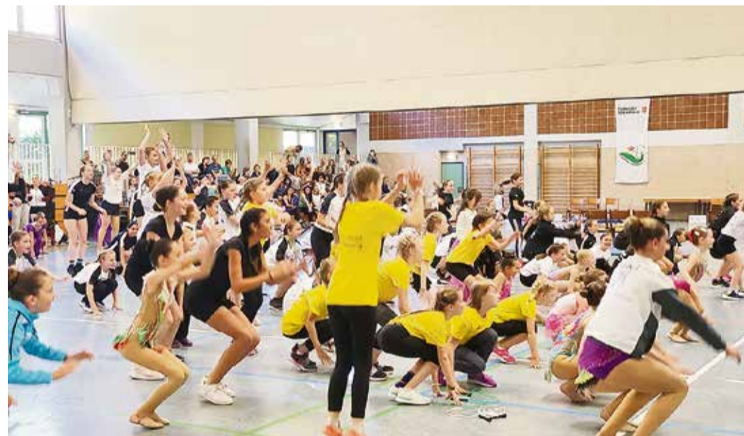
Vor den Wettkämpfen gab es ein gemeinschaftliches Aufwärmen.