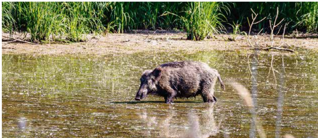
Trügerische Idylle: Ein Wildschwein wadet durch flaches Wasser. In Südhessen achten die Veterinärbehörden auf den Ausbruch der Afrikanischen Schweinepest im Kreis Groß-Gerau, auch der Odenwaldkreis hat sich vorbereitet.