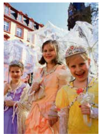
Leben wie Prinzessinnen.

Elfenbeinschnittmeisterinnen etwa 20 Minuten lang die seltene Handwerkskunst und die heute verwendeten Materialien gemäß dem Artenschutz. Anmeldung sind für alle Veranstaltungen außer den Intensivführungen, unter Tel.: 06062-809360 oder per E-Mail an schloss-erbach@schloesser-hessen.com erforderlich. red