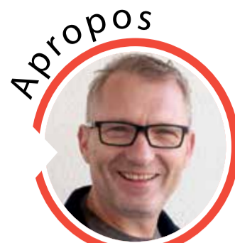
von Volker Zaborowski, Chefredakteur