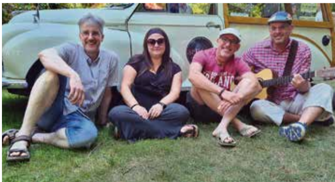
Die Band spielt Irish-Folk.

vier Musiker der „Heebie-Jeebies“ spielen irische Songs, Chantys, Balladen, Jigs, Reels und Polkas. „The Riwwels“ spielen Klassiker aus der Wirtschaftswunderzeit, aber auch Aktuelles im Rock'n Roll-Gewand. Karten gibt es im Vorverkauf für 15 Euro, bei den bekanntesten Vorverkaufsstellen oder per E-Mail an: karten@generation-oberzent.de (zzgl. 2 Euro Versandkosten). red