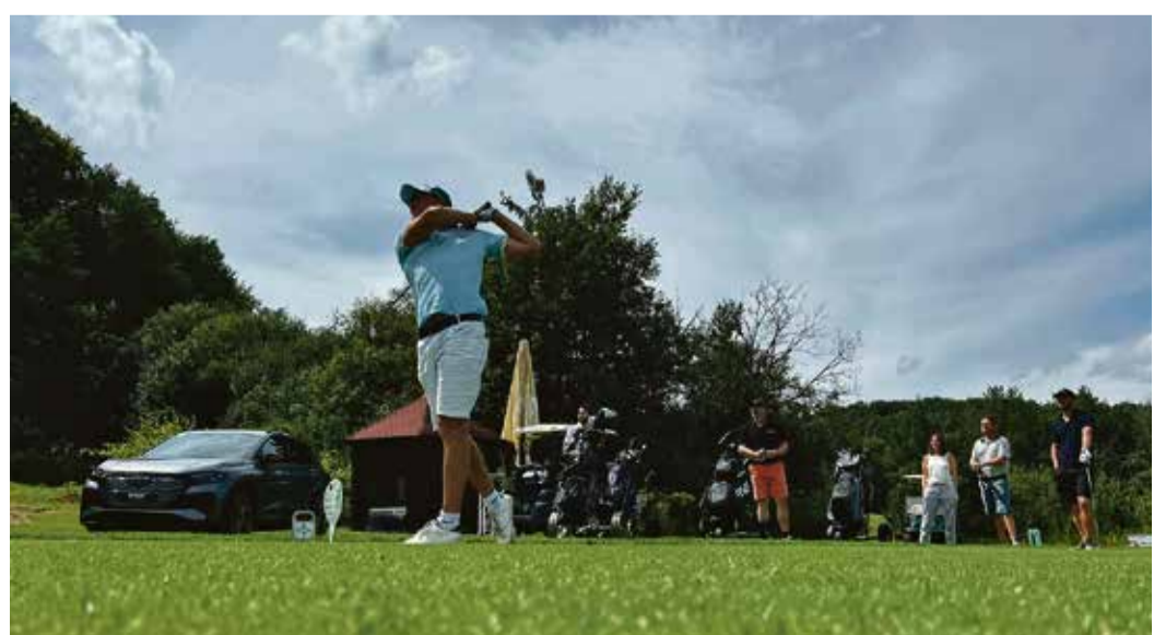
Im Dauereinsatz für den guten Zweck.

Durch erspielte Leistungen und Dank der hohen Spendenbereitschaft im Rahmen der Abendveranstaltung konnten an diesem Spieltag somit insgesamt 959,50 Euro für den VKKD gesammelt werden. red