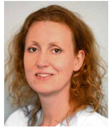
Claudia Priewe Fotos: Asklepios

oder die jeweilige Vertrauensperson der werdenden Mutter schon im Vorfeld mit einzubeziehen und sie informieren gerne über die auf der Geburtstation bereitstehenden Elternzimmer. Bei der abschließenden Führung durch die Kreißsäle und die Geburtstation haben die Teilnehmenden dann die Mög-