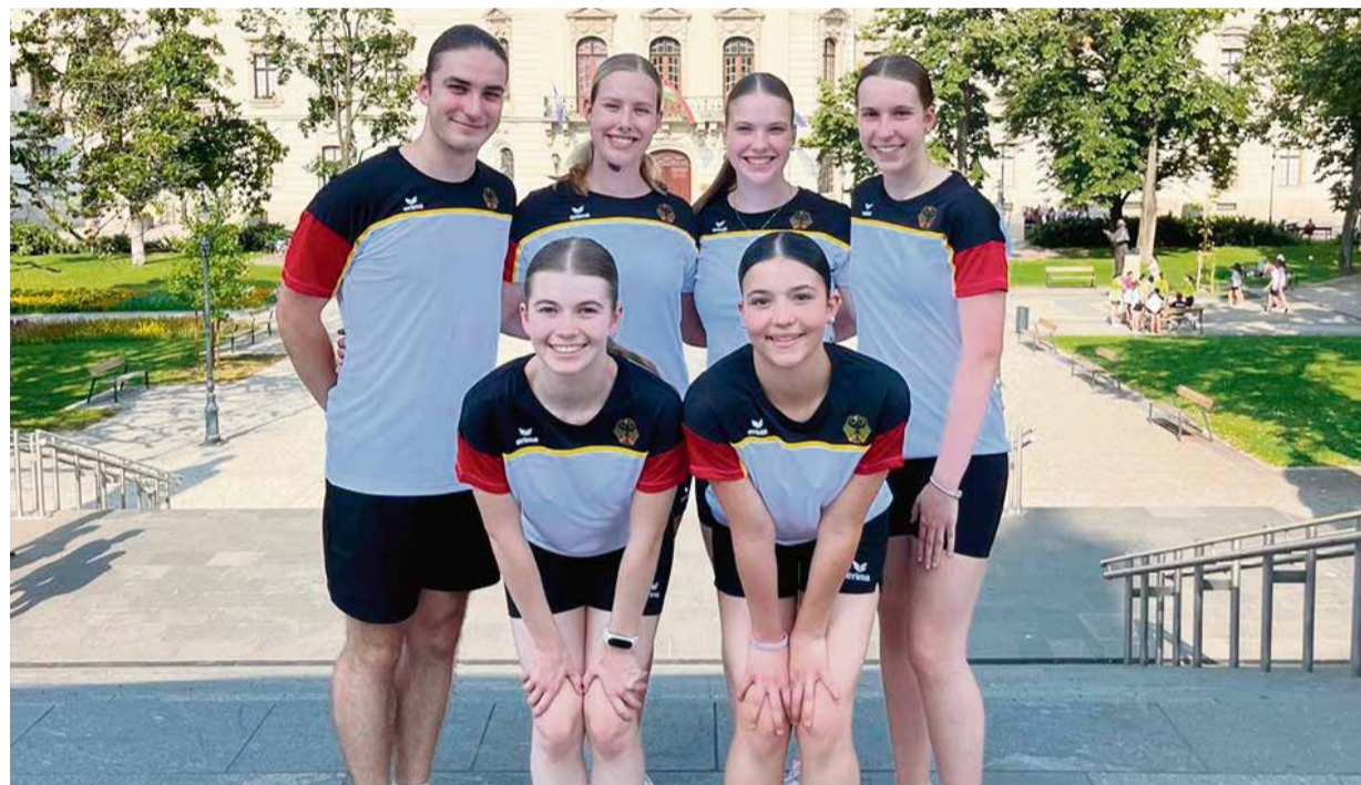
Mit Gold kehrten die Ropeskipper von der Europameisterschaft zurück.