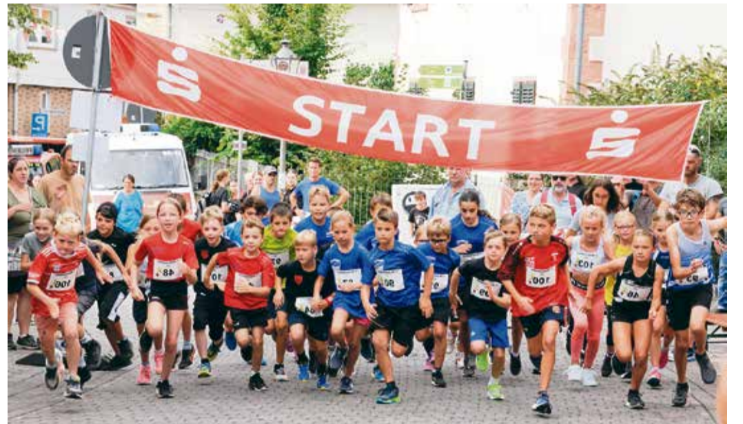
Der Michelsmarktlauf im letzten Jahr - hier starten die Kinder.

und die angrenzenden Felder und Wiesen. Start und Ziel aller Läufe befindet sich im Ortskern direkt am Reichelsheimer Rathaus. Voranmeldungen bis zum 22. August per E-Mail an: triathlon@ksv-reichelsheim.de. Nachmeldungen sind vor Ort bis eine Stunde vor dem jeweiligen Lauf möglich. red