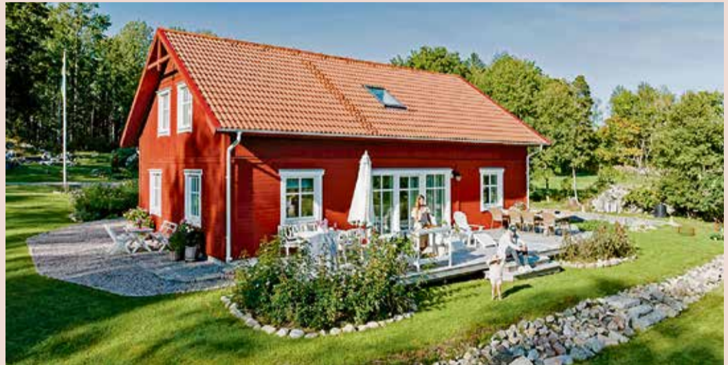
Freiraum für die ganze Familie: Ein Schwedenhaus mit Garten ringsherum bietet zahlreiche Möglichkeiten, sich selbst zu entfalten.