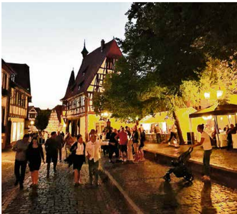
Eine lauschige Feier an einem schönen Sommerabend soll das Altstadtfest wieder werden. Ein Bild aus einem vergangenen Jahr.

Michelstadt. Das Michelstädter Altstadtfest findet traditionell am dritten Wochenende im August, vom 16. bis 18. August, in der Kellerei statt. Der Förderkreis Historisches Michelstadt hat ein abwechslungsreiches Programm für die drei Tage zusammengestellt. Das erste Highlight wartet direkt am Freitagabend nach dem Bieranstich um 19.30 Uhr: The Boombasters spielen ab 21 Uhr auf der Bühne im Kellereihof. Samstag abends rockt Hiptown live