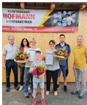
Urkunden und Präsente zum Jubiläum.