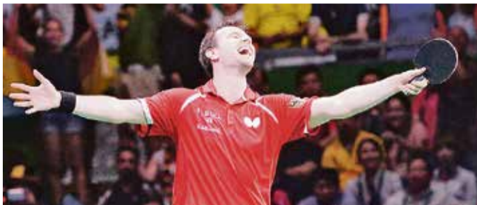
Timo Boll verabschiedet sich von internationaler Bühne Seite 3

In Beerfurth startet die Kerb: Ortskern ist Schauplatz vielfältiger Veranstaltungen Seite 8