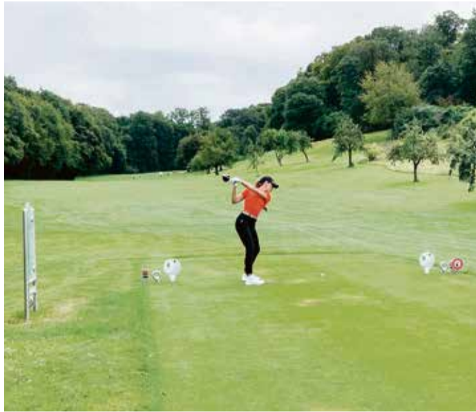
Professionell ging es auf der Charity-Tour zu.

Trotz der widrigen Wetterbedingungen erzielten die Teilnehmer auch in Traisa sehr gute Ergebnisse für den guten Zweck. Insgesamt 19 Birdies, 189 Pars und 247 Bogeys sorgten für erspielte Leistungen in Höhe von insgesamt 407,50 Euro, die dem Verein für krebskranke und chronisch kranke Kinder Darmstadt / Rhein-Main-Neckar e. V. (VKKD) zugutekommen.