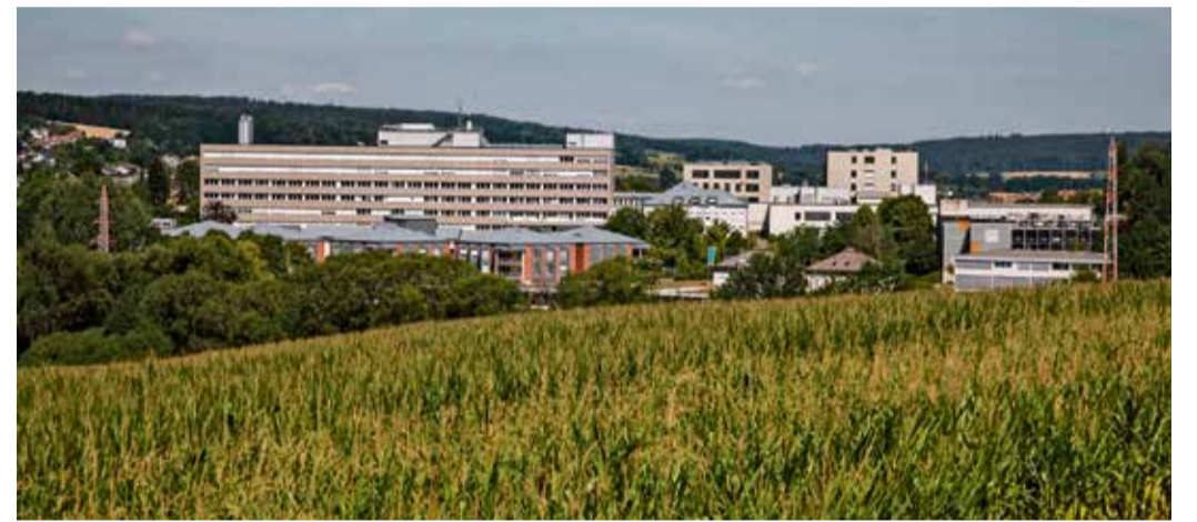
red Das Klinikgebäude.

Das F.A.Z.-Institut wertete in seiner Studie „Deutschlands beste Krankenhäuser“ in Zusammenarbeit mit dem IMWF Institut für Management- und Wirtschaftsforschung Daten von mehr als 1.700 Krankenhaus-Standorten in Deutschland aus. red