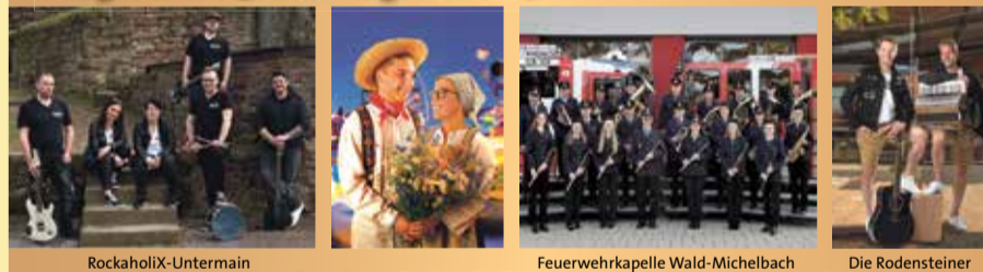
RockaholiX-Untermain Feuerwehrkapelle Wald-Michelbach Die Rodensteiner