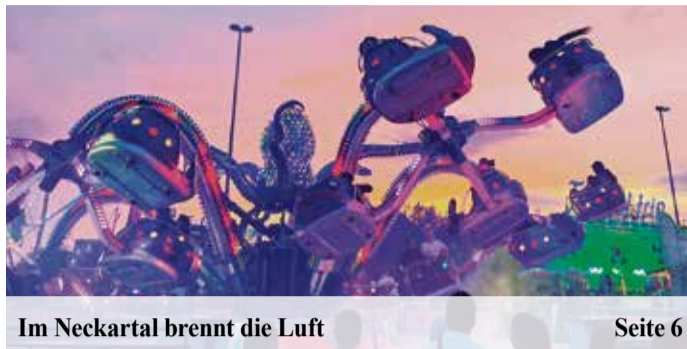
Im Neckartal brennt die Luft