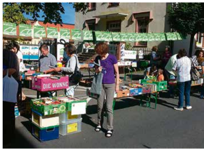
Die Teilnahme ist kostenlos. red Ein reichhaltiges Angebot an „Lesefutter“.

Erbach. Am Sonntag, 8. September, organisiert die Bücherei St. Sophia ab 12 Uhr einen Riesenbücherflohmarkt in der Erbacher Hauptstraße 42 vor dem Gemeindezentrum St. Sophia. Über 3.000 sortierte Bücher, DVDs, CDs Spiele und mehr sollen dort zu finden sein. Am Montag, 9. September, gibt es für Kindergartenkinder und Kinder bis neun Jahre ab 16 Uhr eine Vorlesestunde in der Bücherei mit dem Kamishibai-Vorleseetheater „Ich bin der Stärkste im ganzen Land“.