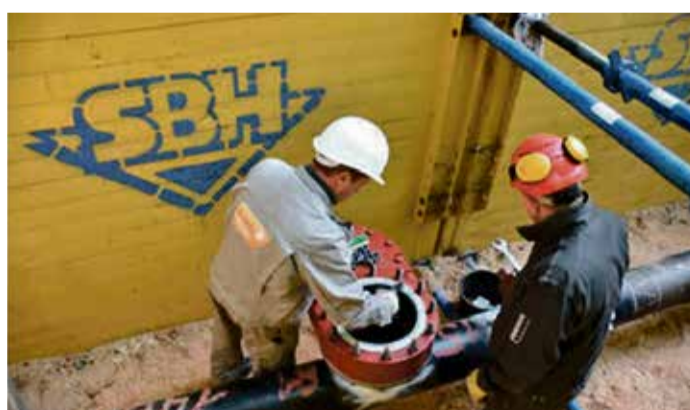
Planen, Absperren und Anbohren: Die e-netz Süd Hessen ist Expertin für die fachgerechte Stoppelung von Gashochdruckleitungen ohne Versorgungsunterbrechung.

Landkreis Darmstadt-Dieburg. Mit Vorbereitungen für Tiefenbohrungen von jeweils 99 Metern begann die e-netz Süd Hessen Ende des ersten Quartals umfangreiche Arbeiten zum Schutz ihrer erdverlegten Gashochdruckleitungen. In der zweiten Jahreshälfte werden die ersten Tiefbauarbeiten starten: Bohrungen an mehreren Stellen im Versorgungsgebiet ermöglichen es dem Verteilnetzbetreiber, ein elektrochemisches Schutzverfahren für Gasleitungen aus Stahl zu installieren. Es schützt die empfindlichen Leitungen vor Korrosion und damit langfristig auch vor Leckagen. Anlagen für den so genannten kathodischen Korrosionsschutz (KKS) werden im Bereich der Lichtwiese in Darmstadt, in Nieder-Ramstadt und im Groß-Umstädter Stadtteil Semd errichtet. Die Maßnahmen sind erforderlich, da die bestehenden Anlagen altersbedingt ersetzt werden müssen. Die Arbeiten dauern voraussichtlich bis Ende Dezember an.