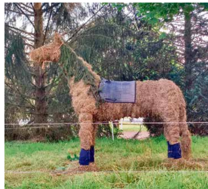
Das „erste Pferd der Rallye“ steht schon bereit.

Höchst. Die Pferdefreunde Forstel planen eine Reiter-Rallye für Sonntag, 15. September, ab 9 Uhr in der Pferdepension Monika in der Forsteler Str. 2 in Höchst-Forstel. Dazu wurde schon ein Strohpferd, das „erste Pferd für die Rallye“ aufgestellt. Wer an der Reiter-Rallye teilnehmen möchte, kann sich noch bis zum 1. September anmelden unter: info@pferdepension-monika.de . Alle Infos auf der Homepage: www.pferdepension-monika.de . red