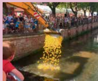
Das beliebte Entenrennen findet auch in diesem Jahr wieder statt.

und Cortina gegen eine Kugel Eis eingetauscht werden können.