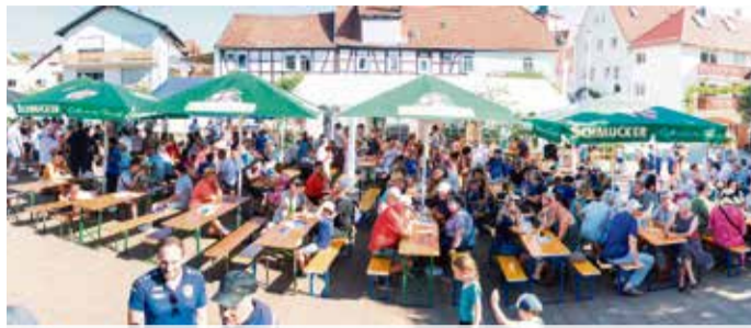
Bad König: Auf der Piazza wird die Kerb gefeiert Seite 6-7

Mehr „Ich will Spaß“: Zweite Verlosung zu NDW gestartet Seite 9