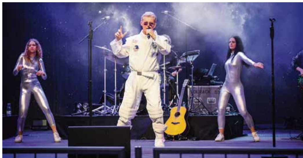
Der hessische Popsänger und NDW-Star Markus bringt eine 80er-Party auf die Bühne.

Um die Vorfreude weiter anzuheizen, verlost das Odenwälder Journal ein weiteres Mal 3x2 Karten für dieses Ereignis – Interessierte schicken eine Nachricht mit der Betreffzeile „NDW2“ bis zum 9. September an: info@odw-journal.de . Der Rechtsweg ist ausgeschlossen. red