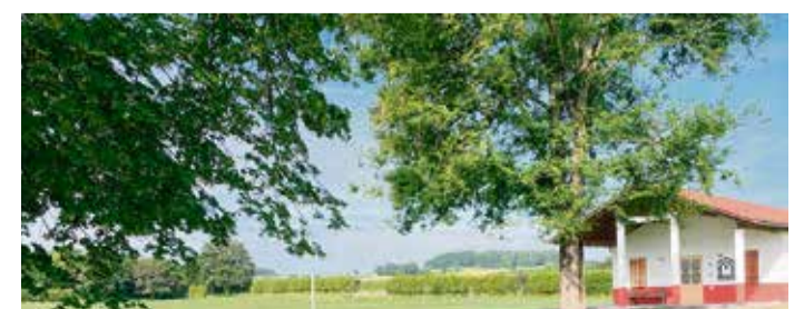
Die Villa Haselburg.

verfolgen und die Schafzucht und Textilherstellung im antiken Rom kennenlernen. Ebenso werden verschiedene Schafzassen hinsichtlich ihrer unterschiedlichen Wolle vorgestellt. Für das leibliche Wohl wird mit Gerichten vom Odenwälder Weidelamm, Kaffee, Kuchen und Waffeln gesorgt. Unter den vielen Mitmachaktionen bieten zum Beispiel die Bowhunter Hummethroth Bogenschießen zum Ausprobieren an. red