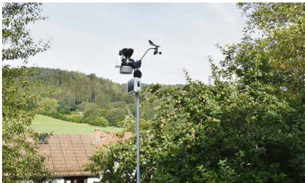
Liefert verlässlich Daten: eine von mehreren Wetterstationen in Oberzent.