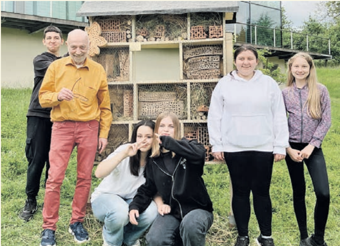
Die Projektgestalter vor dem neuen Insektenhotel an der Reichelsheimer GAZ.