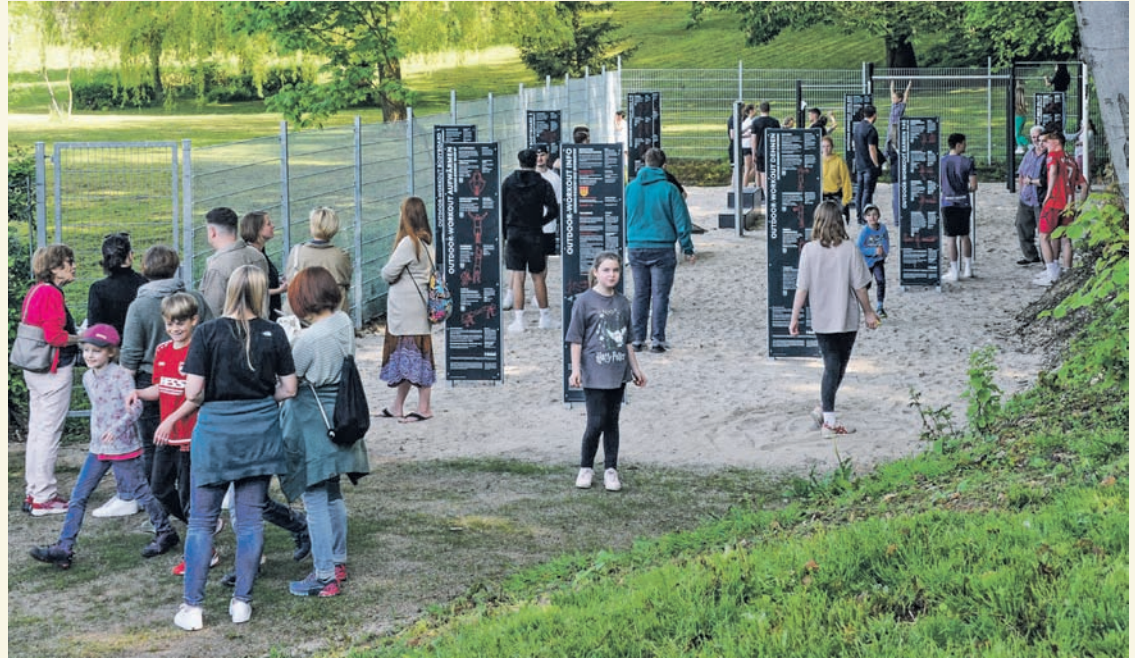
Der neue Bolzplatz der Gemeinde an der Konrad-Adenauer-Allee umfasst neben einem Fußball- und einem Basketballfeld auch eine Weitsprunganlage und zahlreiche Bewegungsgeräte.

Darüber hinaus stehen ein Fußball- und ein Basketballfeld zur Verfügung. Im hinteren Teil des Platzes finden die Nutzer Bewegungsgeräte. So reiht sich der neue Bolzplatz mit seinen zusätzlichen Sitzgelegenheiten in jene, die bereits in einzelnen Ortsteilen der Gemeinde existieren, ein. Bereits 1988/89 wurde vom östlichen Ende