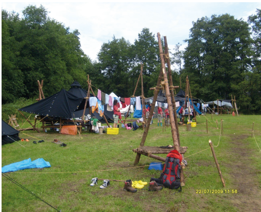
Volle Power Camp bzw. Wassercamp in Grebenhain 2009

Unter Pfarrer Großkopf gab es 2003 den ersten Kontakt zu den Royal