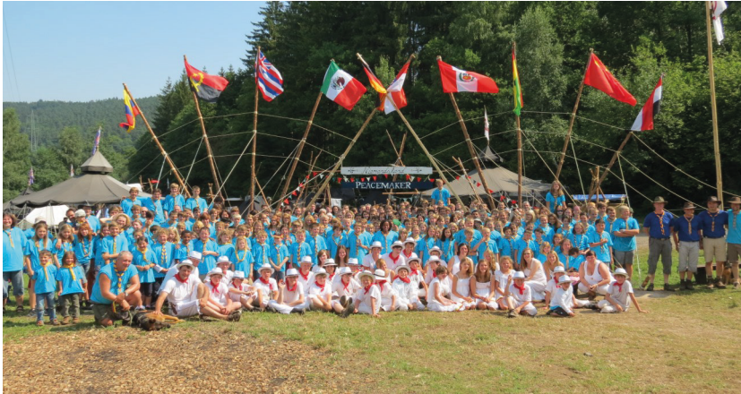
Peacemaker Camp 2012

und der evangelischen Kirchengemeinde Erzhausen eine Kooperation, um die Pfadfinderarbeit vorzubauen. Zusammen wurde 2004 der Stamm 348 Langen - Erzhausen gegründet und am 02. Oktober 2004 starteten wir mit unserem ersten Pfadfinderjahr wieder konstant bei um die 70 Rangers in Erzhausen an. Zusammen mit den Rangers aus Langen wuchs der Stamm in der Hochzeit 2009 auf 112