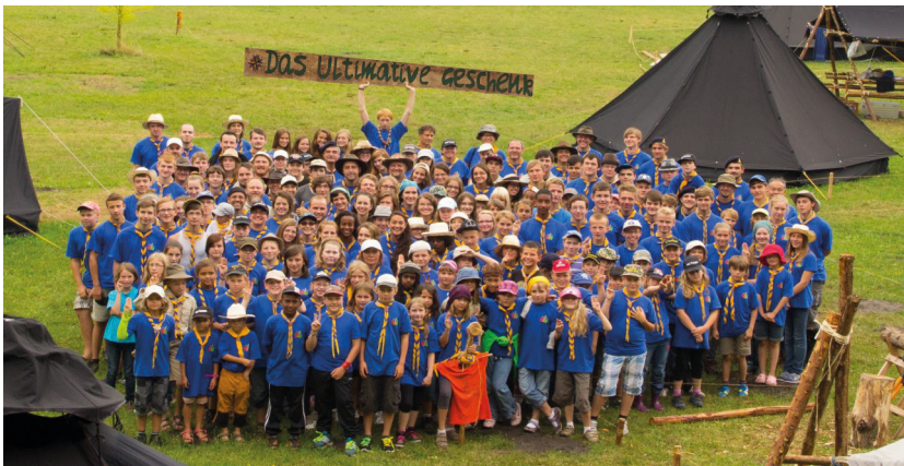
Das ultimative Geschenk 2013

gründet und am 02. Oktober 2004 Rangers und hielt sich in den letzten Jahren wieder konstant bei um die 70