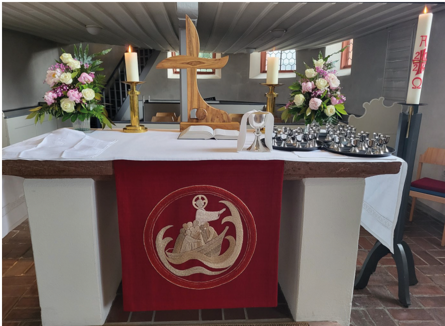
Altar am Pfingstgottesdienst 2024