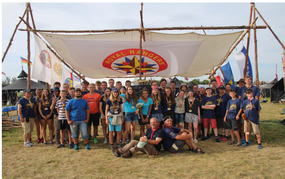
Eurocamp 2016 in Wroclaw (Breslau)