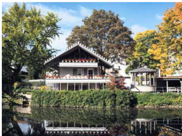
Das Petrihaus am Ufer der Nidda.