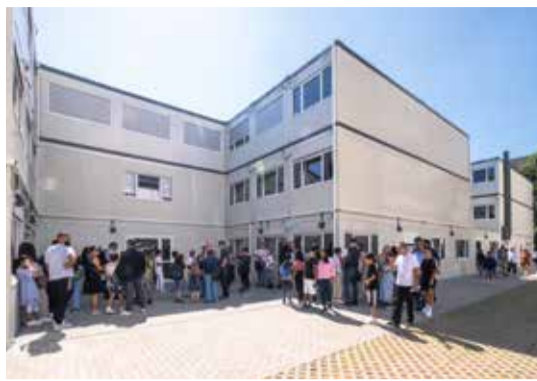
Blick auf das Container-Interim der Gymnasien.