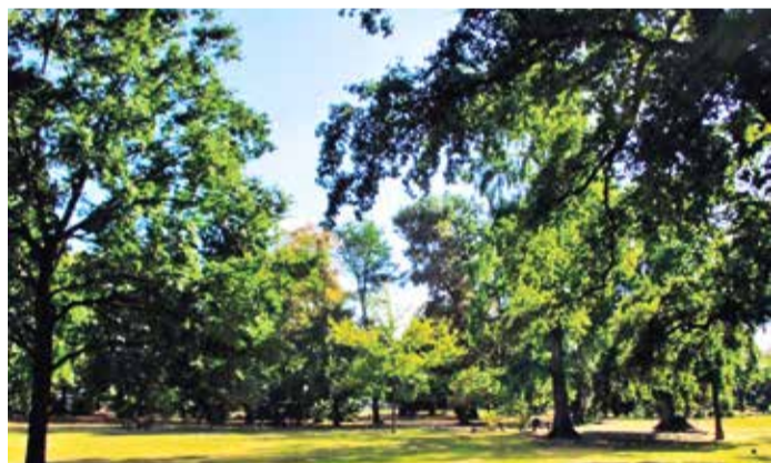
Brentanopark – Parkansicht.

Die Sternbrücke Rödelheim, eine steinerne Straßenbrücke aus dem 19. Jahrhundert, verbindet die Stadtteile Rödelheim und Bockenheim über den ehemaligen Ochsengraben. Mit ihrer barocken Architektur und ihren sieben Brückenbögen ist sie nicht nur ein historisches Bauwerk, sondern auch ein wichtiger Verkehrsknotenpunkt im Stadtteil. BU: Nur ein historisches Bauwerk -die Sternbrücke Rödelheim, Nordseite