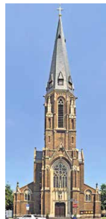
Die förmlich in den Himmel ragenden Antoniuskirche.