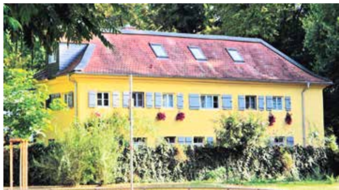
Ehemaliges Küchenhaus des Landhauses der Brentanos.