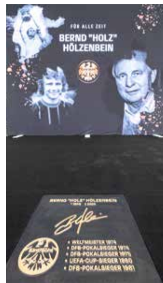
Bronzetafel zu Ehren Bernd „Holz“ Hölzenbeins, Weltmeister 1974.

zung 1899“, Tafel 2: „Deutscher Meister 1959“, Tafel 3: „DFB Pokalsieger 1974“, Tafel 4 „Grabowski“, Tafel 5: „Nickel“, Tafel 6: „Hölzenbein“. Die Platten wurden von einem Entscheidungsgremium ausgewählt, dem Vertreterinnen und Vertreter der Eintracht, des Instituts für Stadtgeschichte, der Sportpark Stadion GmbH und der Fanszene angehören. „Für alle Zeit“ wird im Laufe der Zeit immer wieder ergänzt, die nächste Verlegung ist für das Frühjahr 2025 geplant. Dann soll auch eine Tafel in Erinnerung an die Eröffnung des Stadions im Mai 1925 verlegt werden.