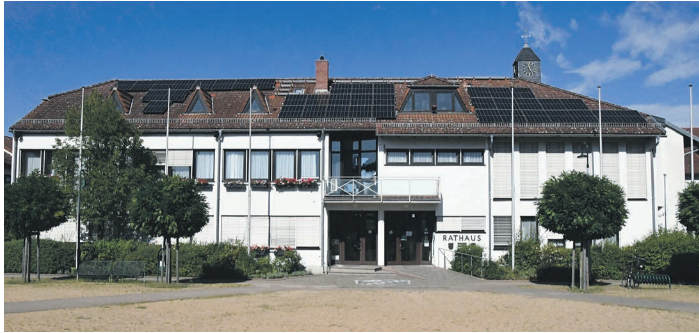
Die Photovoltaik-Anlage auf dem Eppertshäuser Rathaus ging im November 2023 in Betrieb. Binnen neun Monaten folgten drei weitere Anlagen auf kommunalen Liegenschaften - auch ohne eigenen Klimaschutz-Manager.

Eppertshausen (jedö) Vorweg: Echte Fortschritte beim geplanten riesigen Solarpark zwischen Thomashütte und Rallenteich nahe Eppertshausen gibt es derzeit nicht. Im Sommer 2023 war die Greenovative GmbH aus Nürnberg mit ihrem Plan an die Öffentlichkeit gegangen, die im Volksmund nach dem früheren Eigentümer benannte „Merck-Wiese“ zwischen dem Gutshof und dem Naturschutz-Gebiet mit einer riesigen Photovoltaik-Anlage zu bebauen. Neben einer Investition von 7,5 Millionen Euro und finanziellen Beteiligungsmöglichkeiten für die Bürger hätte dies auch die zumindest rechnerische Versorgung sämtlicher 2 700 Haushalte in Eppertshausen mit Solarstrom zur Folge. Schon Anfang des Jahres war das mit bis zu 15 500 Paneelen auf neun Hektar gigantisch anmutende Projekt ins Stocken geraten, woran sich bis jetzt nichts geändert hat. Aktuell steht die Wiese als Grünfläche im Regionalplan, müsste dort im Zuge eines komplizierten Zielabweichungs-Verfahrens zur Fläche für die Energieerzeugung umdeklariert werden - oder das Unternehmen müsste in der Gemarkung neun Hektar Grünland als Ausgleichs-