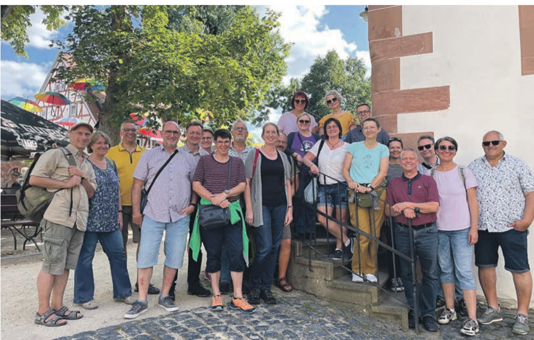
Teilnehmer des Chor-Ausflugs auf der Treppe am Wambolt'schen Schloss in Groß Umstadt.

Begleitung für Gottesdienste interpretiert werden soll. Jederzeit herzlich willkommen sind Interessenten, die erstmals oder nach längerer Pause wieder im Chor mitsingen möchten. Daneben wird sich der Vorstand des Chores am 9. September in einer außerordentlichen Zusammenkunft erstmals mit der konkreten Planung des für den Herbst 2025 vorgesehenen Chorkonzertes befassen.