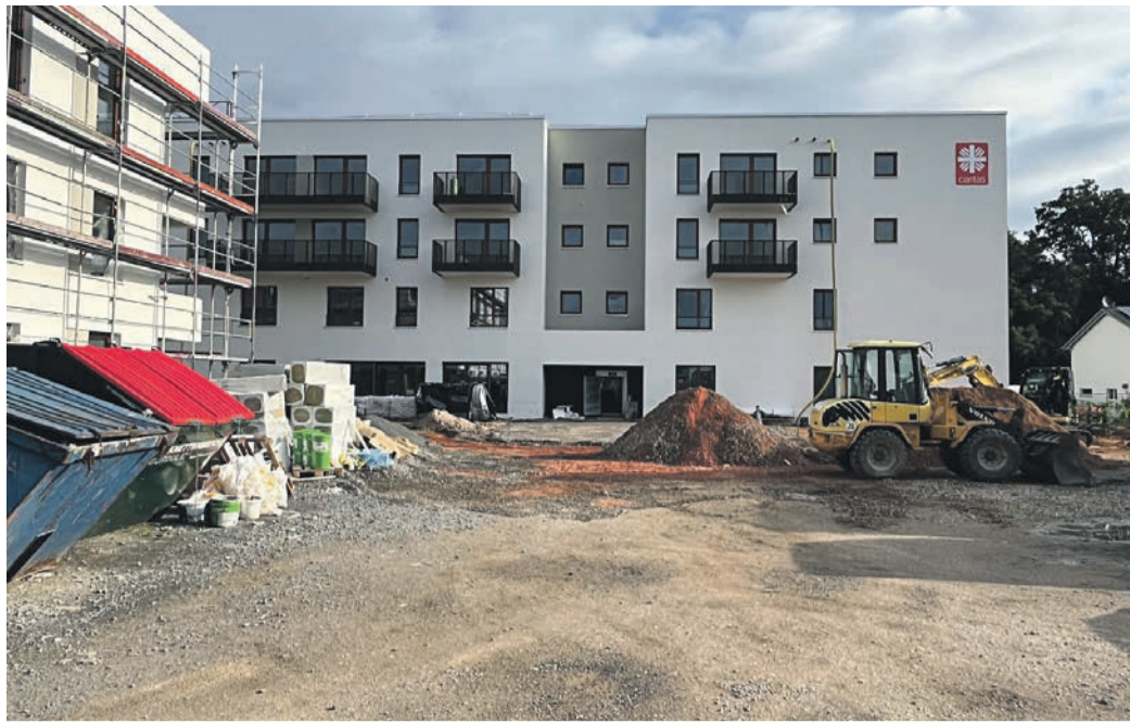
Das Seniorenzentrum in Eppertshausen hat mit Hildegard von Bingen nun auch seine Namenspatronin gefunden.