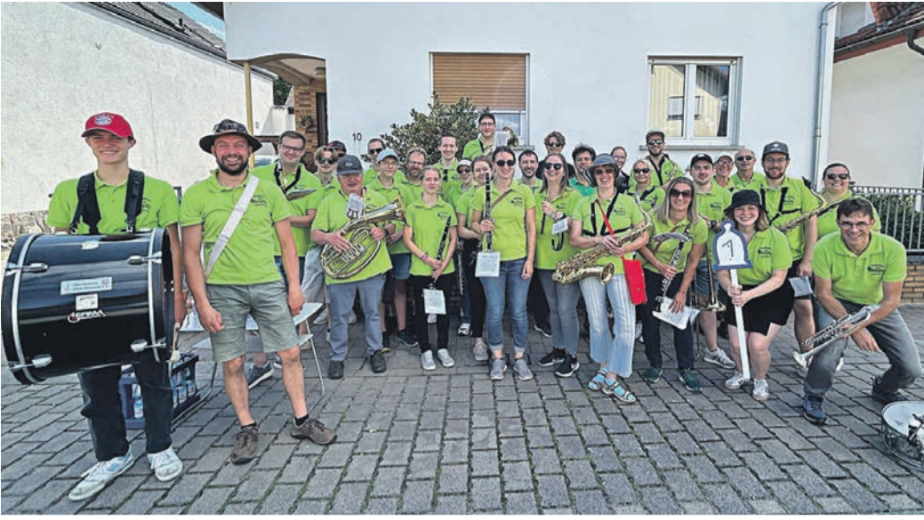
Am vergangenen Sonntag fand der diesjährige Kerbumzug des Kerbvereins Groß-Zimmern statt. Wie auch im vergangenen Jahr nahm der MVM mit etwa 30 Musikern und Musikerinnen aus allen drei Orchestern daran teil und führte den rund zweistündigen Umzug durch den Ort an.