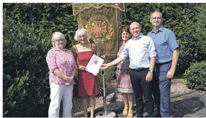
Im Rahmen des Förderprogramms „Ehrenamt digitalisiert!“ überreichte Europaminister Manfred Pentz einen Förderbescheid an den TAV 1890 Eppertshausen.

Leichtathletik: Mittwoch ab 2. Klasse 16 - 17.30 Uhr; Freitag ab 1. Klasse 14.30 - 15.30 Uhr; Freitag ab 5. Klasse 15.30 - 17