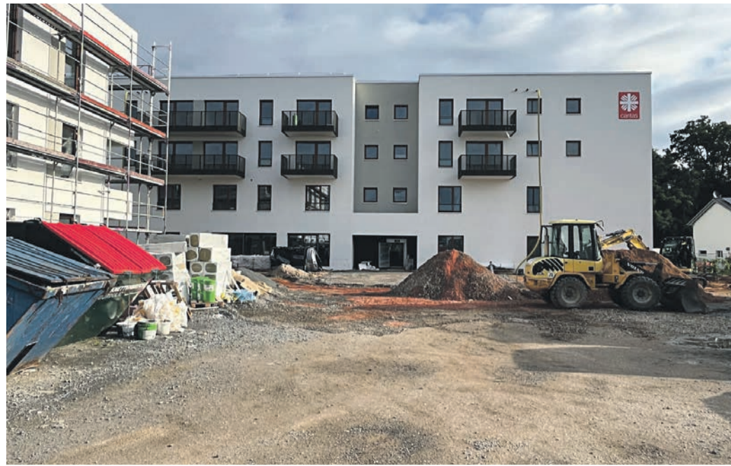
Das Seniorenzentrum in Eppertshausen hat mit Hildegard von Bingen nun auch seine Namenspatronin gefunden.