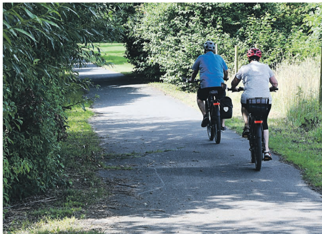
Vernachlässigte Infrastruktur oder Lappalie? Der Weg am Stillgraben hebt sich an manchen Stellen durch die Wurzeln der Bäume - eins von vielen Beispielen, mit denen Münsterer und Altheimer die Gemeinde auf Mängel im Ortsbild aufmerksam machen. Nicht immer sind sie mit der Reaktion(sgeschwindigkeit) von Verwaltung und Bauhof zufrieden.

Beginnen wir in Alheim, wo sich einige Bürger schon seit längerer Zeit beklagen, ihr Ortsteil mit seinen infrastrukturellen Belangen werde von der Kommune im Vergleich zu Münster vernachlässigt. Beschwerden - meist auch direkt im Rathaus kundgetan - gab es zuletzt beispielsweise über den Zustand der Fahrrad-Abstellanlage an der Bushaltestelle „Alheim Feuerwehr“, die von der Buslinie ME (Münster-Epertshausen) angedient wird. „Sie ist aus Holz und in die Jahre gekommen, ich kann nachvollziehen, dass man das nicht schön findet“, sagt Schledt, um sogleich näher zu erläutern, dass der Teufel oft im Detail und teils auch auf anderen Ebenen liegt: „Wir arbeiten dort an einer barrierefreien Haltestelle. Der Kreis hat aber die Fördermittel für den barrierefreien Umbau von Bushaltestellen gekürzt. Wir prüfen zum einen, ob diese Haltestelle davon betroffen ist.“ Zum anderen seien nur Haltestellen mit einer Mindestlänge von 15 Metern für einen Umbau förderfähig. Jene an der Alheimer Feuerwehr ist kürzer, müsste daher verlegt werden. Ein Vorhaben, das die Sache deutlich komplizierter