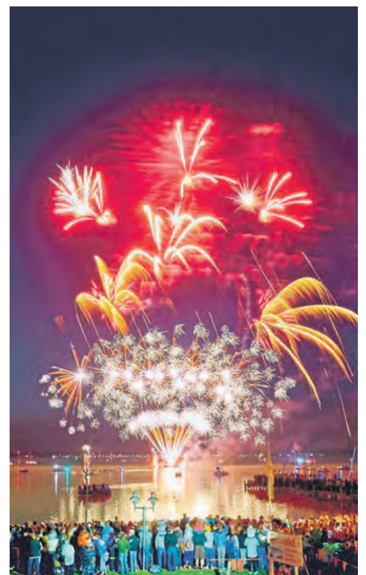
Zum Finale des Festlichen Wochenendes am Steinhuder Meer steigt ein Feuerwerk über dem See empor.