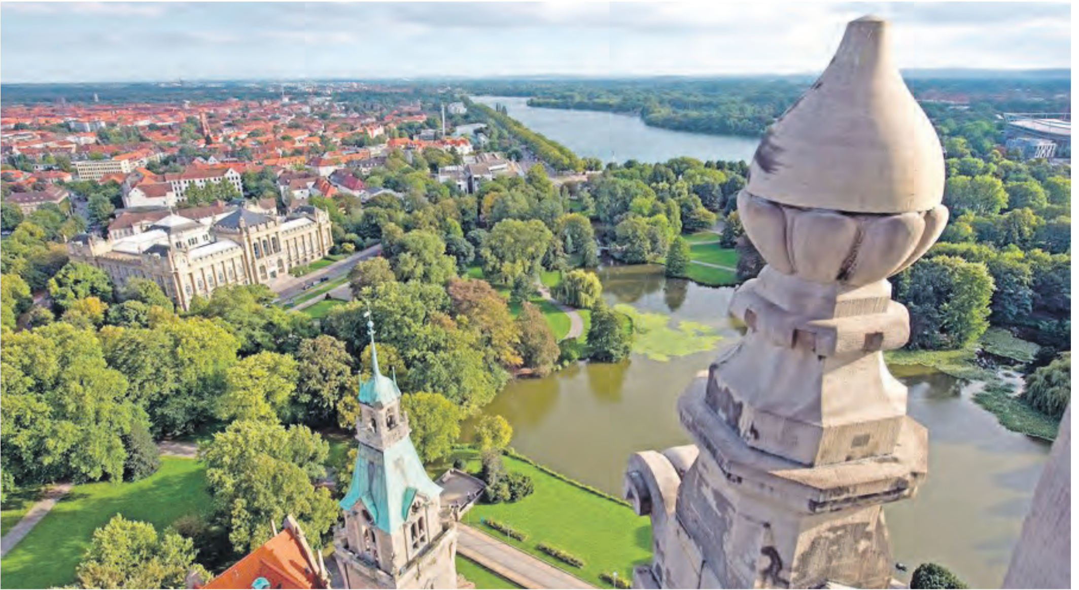
Von der Rathauskuppel reicht der Ausblick weit über das Landesmuseum und den Maschsee hinaus.