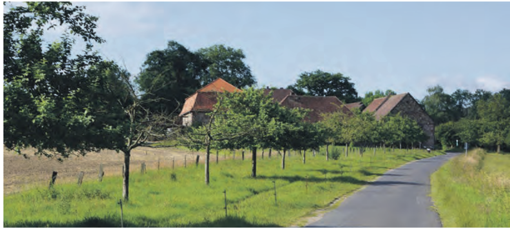
Nordansicht des Hofguts Patershausen.

Heusenstamm (NZH) Das städtische Hofgut Patershausen soll zum 1. Oktober 2025 für die Laufzeit von 18 Jahren eine neue Pächterin beziehungsweise einen neuen Pächter bekommen. Die Stadt hat gestern die Ausschreibung gestartet und fachlich versierte Personen können ihr Interesse bis Dienstag, 24. September, bekunden. Gesucht werden erfahrene Landwirtinnen und Landwirte, die eine abgeschlossene landwirtschaftliche Meister- oder Techniker Ausbildung oder eine mindestens gleichwertige Qualifikation aufweisen. Zum Hofgut selbst gehört eine Gesamtfläche von ca. 74 Hektar. Die landwirtschaftlichen Flächen liegen voll arrondiert und umfassen ca. 61 Hektar Ackerland, zwei Hektar Grünland, 1,2 Hektar Hoffläche und zehn Hektar sonstige Flächen, wie Kompensationsflächen Streuobst und Wald, Gehölzflächen und Naturschutzgebiet. Das Hofgut wird als Rindermast-/Marktfruchtbetrieb mit Rindermast, Direktvermarktung und eigener Schlachtung betrieben. Der Betrieb soll ökologisch (mindestens EU-Öko) bewirtschaftet werden. Eine Besichtigung des laufenden Betriebs ist nur nach Aufforderung gestattet. Interessentinnen und Interessenten, die die fachlichen und finanziellen Voraussetzungen erfüllen, können gegen eine Gebühr von 50 Euro ein aus-