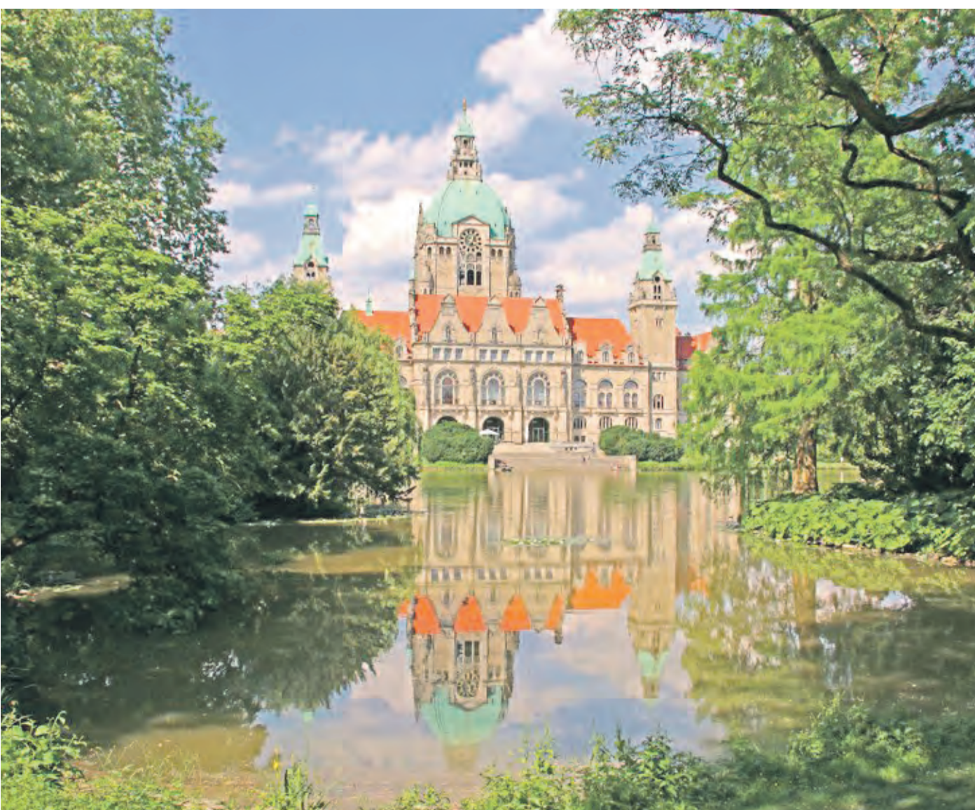
Hannovers Neues Rathaus liegt mitten in der Stadt am idyllischen Maschteich.

verCard tourist sogar kostenlos – oder die Familie nimmt ihr Quartier im Grünen und fährt umgekehrt zum Sightseeing in die Stadt. Auf den bewaldeten Deister führen Wanderwege zu schönen Aussichtspunkten und Ausflugslokalen, während der Radweg „Deister-Kreisel“ den Höhenzug einmal umrundet mit mehrfacher Anbindung an die S-Bahn. Und das Steinhuder Meer lädt als größter See in Nordwestdeutschland zum Baden und Paddeln, Segeln und Surfen, Fischbrötchen essen und Vögel beobachten ein.