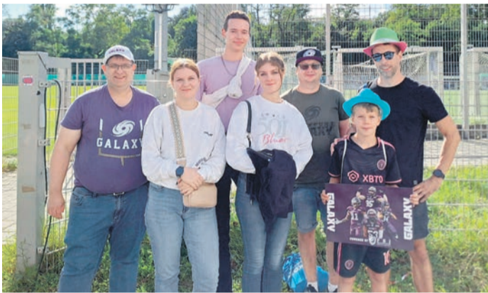
Die ZVB'ler nach dem Spiel bei der Frankfurt Galaxy. Trotz der Niederlage hatten alle einen tollen Tag rund um American Football und die Frankfurt Galaxy.

Hierbei wurden auch die wichtigsten Football-Regeln und das Fan-Verhalten erörtert, so dass auch die Football-Neulinge später das Spiel gut verfolgen konnten. Auch wenn es für die Galaxy im letzten Heim- und Saisonspiel 2024 um nichts mehr ging, da man keine Chance mehr auf das Erreichen der Play-Offs hatte, so