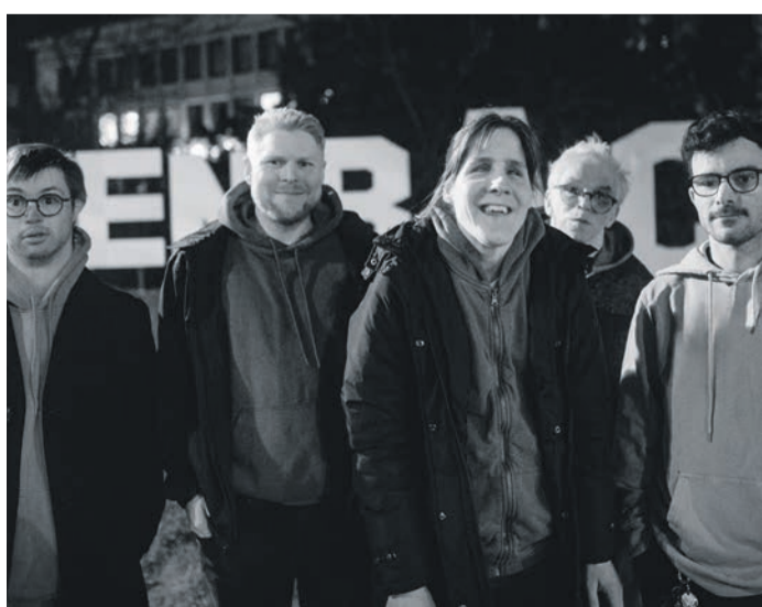
Die Gruppe Blumenstrauss beginnt am Freitag, 13. September, um 18.15 Uhr mit ihrem Konzert und stimmt das Publikum dann schon ordentlich ein, bevor die Lieblingsband im Anschluss auf die Bühne tritt.