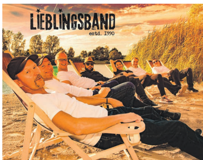
Zum Abschluss des städtischen Kultursommers treten die Musiker von Lieblingband im Beethovenpark auf die Bühne, sie sind für The Gypsys eingesprungen, die leider kurzfristig absagen mussten.

Aufgrund mangelnder Parkplätze am Veranstaltungsort werden die Gäste gebeten am besten mit öffentlichen Verkehrsmitteln, per Rad oder zu Fuß oder vielleicht mit dem Hopper anzureisen.