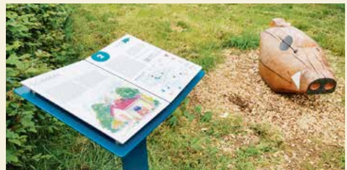
Märchentafeln sollen die aufgestellten Figuren näherbringen und ergänzen.

Die Verleihung des Wildweibchenpreises findet im Rahmen des Märchenfestabends an den Märchen- und Sagentagen am Samstag, 26. Oktober, um 19 Uhr im Regionalmuseum der Gemeinde Reichelsheim statt. Weidmann/red