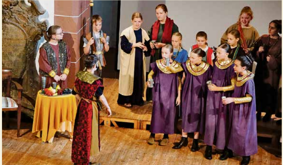
Premiere für das Musical der biblischen Geschichte.

Zur Geschichte: Es herrscht Partystimmung am Hof des babylonischen Königs Belsazar. Gerade hat der König entschieden, dass man doch anstelle von Tonbechern jetzt die silbernen Gefäße zum Trinken verwenden könne, die er als Kriegsbeute aus dem Jerusalemer Tempel mitgehen lassen. Da erscheint plötzlich eine Schrift an der Wand. „Was hat das zu bedeuten?“ haucht es entsetzt aus den Kehlen der 30 Mädchen und Jungen des Kinderchores der evangelischen Michaelsgemeinde.