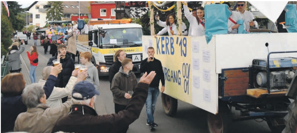
Ein Bild aus der Vor-Corona-Zeit, als beim Eppertshäuser Kerbumzug noch Wagen mitfuhren. Nach fünf Jahren ohne kehren sie 2024 zurück. Veranstalter des viertägigen Treibens vom 4. bis 7. Oktober ist erstmals der neue Kerbverein.