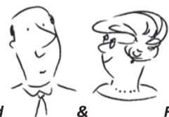
Manfred & Frauke

Jugendfeuerwehr: Die Jugendfeuerwehr trifft sich montags von 18 – 19.30 Uhr im Feuerwehrhaus. Mitmachen können Jugendliche von 10 bis 17 Jahren.