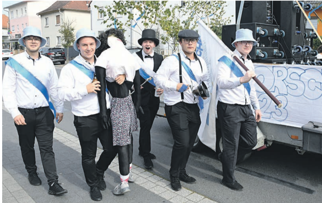
2023 bestand der Münsterer Kerbjahrgang aus nur fünf Burschen. Diesmal sind es doppelt so viele. Wegen schwieriger Helfersuche ist der Kerbverein allerdings nicht sorgenfrei.