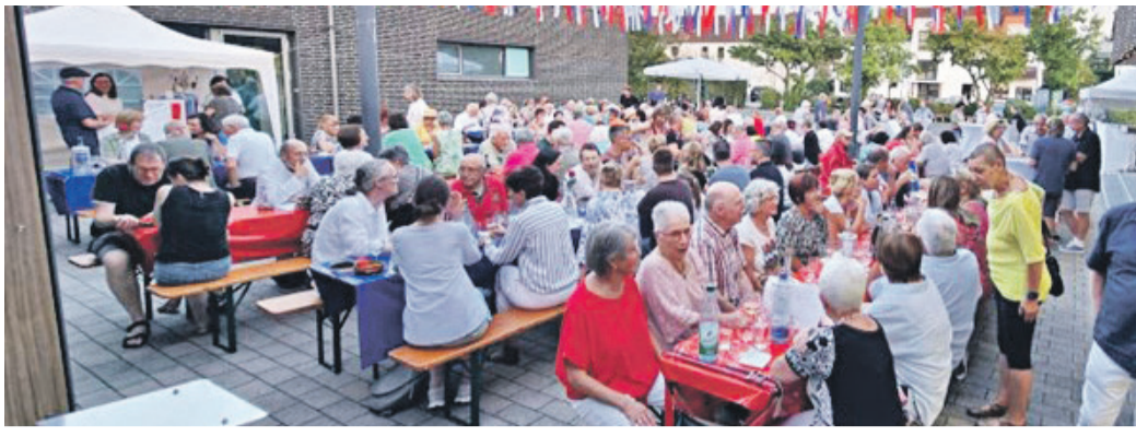
Über 200 Besucher genossen französische Spezialitäten an der Bürgerhalle.

Kinder ab 8 Jahren können bei „Start Up the Band“ ihr erstes Blasinstrument, von Tuba bis Klarinette und Querflöte, oder das Schlagzeug erlernen. Musiziert wird sowohl in der Gruppe als auch im Einzelunterricht. Die Proben starten am 20. September und finden jeden Freitag um 16 Uhr statt. Anmeldung per Mail an ausbildung@mvm1914.de sowie weitere Infos unter www.mvm1914.de .