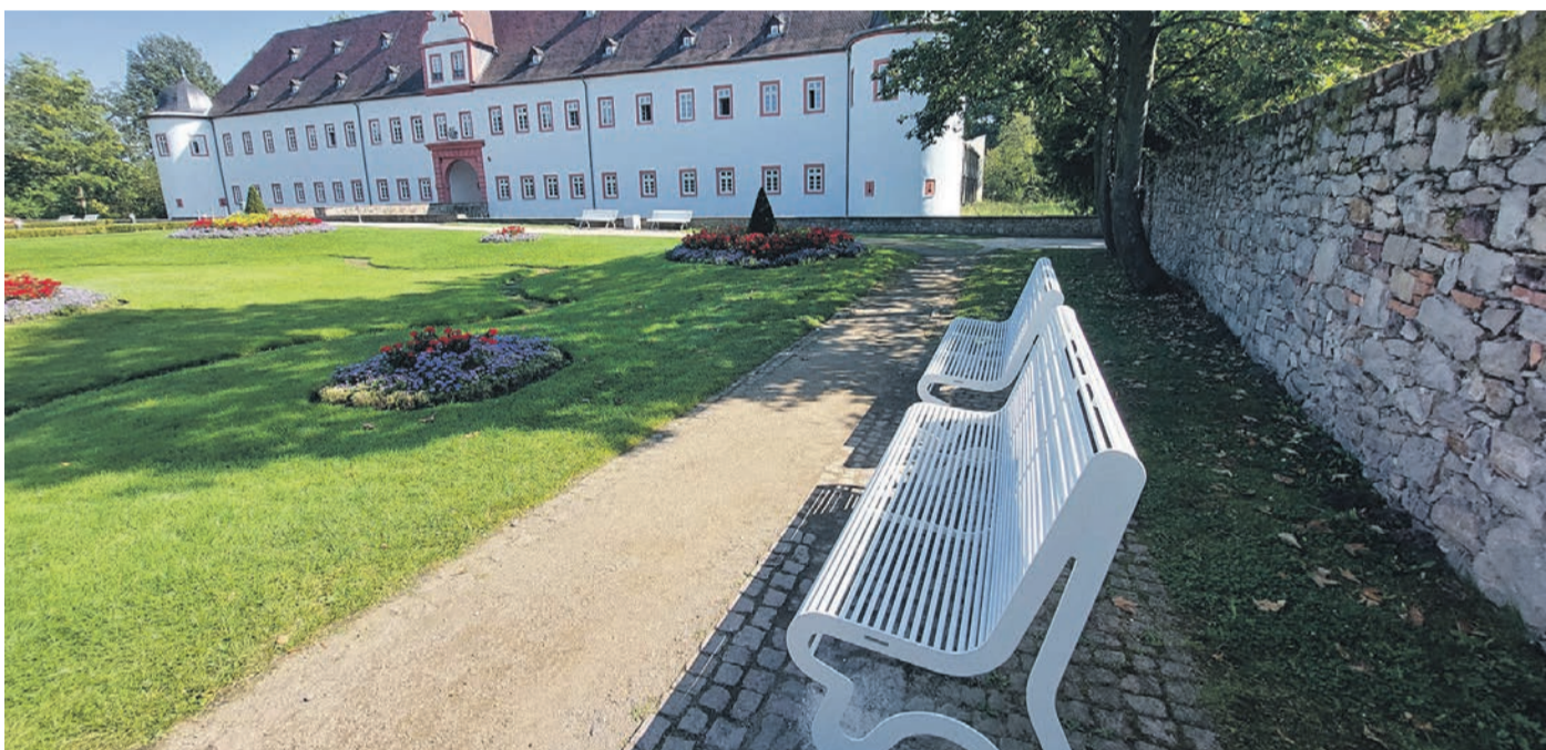
Die ersten neuen Parkbänke sind im Schlossgarten montiert.

Auch ein schwarzer Daimler, der in unmittelbarer Nähe zum blauen Fiat Panda parkte, wurde im gleichen Zeitraum über die gesamte Fahrerseite beschädigt. Der dadurch entstandene Sachschaden wird auf 2.000 Euro geschätzt. Die Polizei bittet Zeugen, sich bei der Polizei in Heusenstamm unter der Rufnummer 06104 6908-0 zu melden.