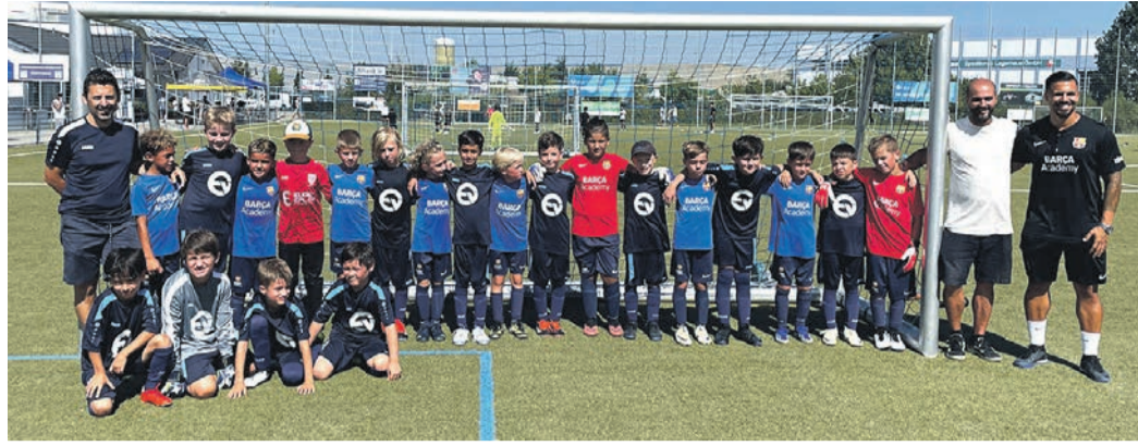
Mannschaftsfoto der Akademie FC Barcelona Zürich mit der TSV Heusenstamm.

Der SC Verl, Drittligist und das älteste Team mit 2 U10 Mannschaften siegt beim Leistungsvergleich der U9/U10 nach dem Twin Modus in Heusenstamm. Bei hochsommerlichen Temperaturen gaben die 12 Teams aus sieben Vereinen alles. Am Ende brachte der Leistungsvergleich nachfolgende Ergebnisse: 1. SC Verl (2 Teams U10), 2. Eintracht Frankfurt (2 Teams U9), 3. TV Würzburg (2 Teams U9/U10), 4. Barcelona Fussball Akademie Zürich (2 Teams U9/U10), 5. Fußball Akademie Wiesloch und VFR Kesselstadt je 1 Team (U9/U10), 6. TSV Heusenstamm 2 Teams (U9/U10).