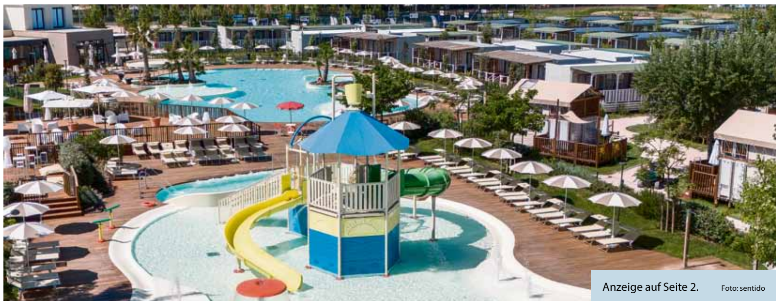
Anzeige auf Seite 2.