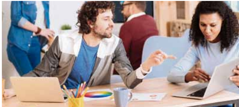
Wenn mehrere Menschen gemeinsam an einem Projekt arbeiten, muss einer die Führung übernehmen.

Der Online-Lehrgang „Projektmanager/Projektmanagerin“ der IHK-Akademie Koblenz ist bei