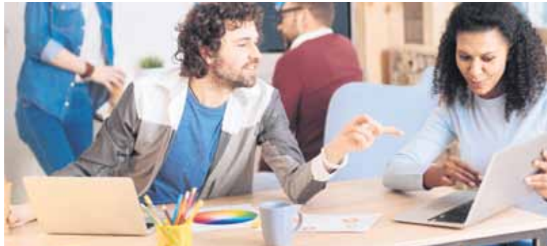
Wenn mehrere Menschen gemeinsam an einem Projekt arbeiten, muss einer die Führung übernehmen.

Der Online-Lehrgang „Projektmanager/Projektmanagerin“ der IHK-Akademie Koblenz ist bei