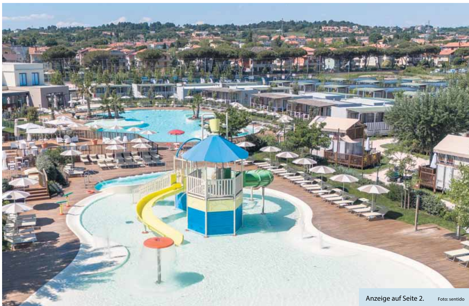
Anzeige auf Seite 2.

Komfort in der Wildnis Warum Glamping das neue Camping ist