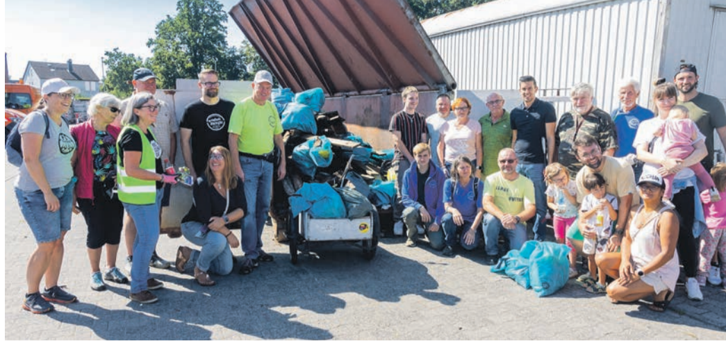
Fleißige Müllsammler waren unterwegs.

Eine Zigarettenkippe, unachtsam weggeschmissen, vergiftet nach neuester Erkenntnissen bis zu 1.000 Liter Grundwas-