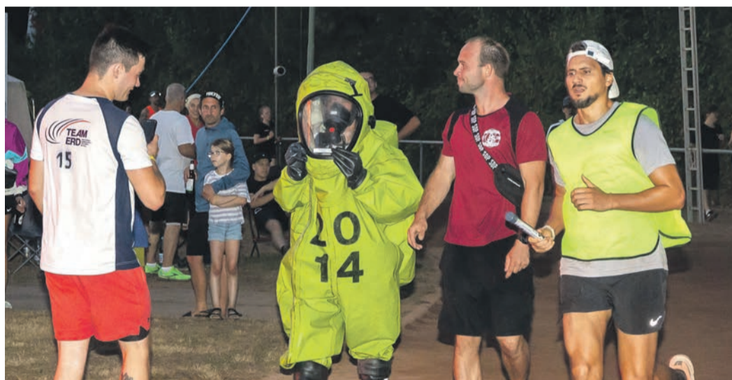
Extra Spenden gab es für Läufe mit besonderer Kleidung.

Nieder-Roden • Hanauer Str. 12 „Das gönnt' ich mir“: ein neuer Schnitt, neue Farbe und schöne Augenbrauen! Damit sind Sie 2024 wieder voll im Trend! Telefon 0 61 06 / 77 14 50 TEAM RIES FRISEUR · KOSMETIK WWW.FRISUR-RIES.DE