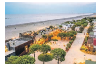
Sentido Punta Marina Premium Camp