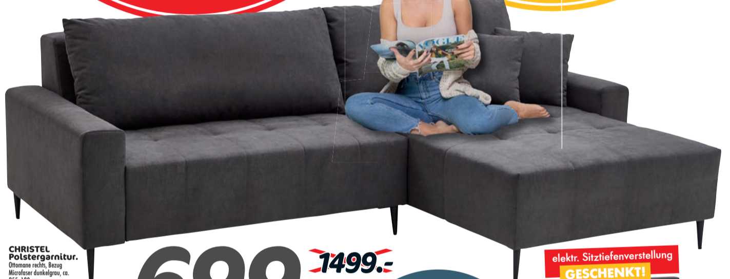
CHRISTEL Polstergarnitur. Ottomane rechts, Bezug Mikrofaser dunkelgrau, ca. 255x180 cm Stellfläche, mit elektrischer Sitztiefeverstellung, inkl. Rücken- und Zierkissen.