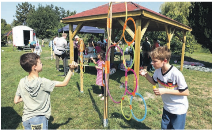
Seifenblasen-Zielpusten bei der Sommerfest-Olympiade der Kinder- und Jugendfarm Rodgau.

Wer entsprechende Sachspenden hat, kann diese am kommenden Dienstag, 17. September, zwischen 15 und 18 Uhr am Bürgerhaus in Dudenhofen abgeben. Spender melden sich direkt am Haupteingang des Bürgerhauses.