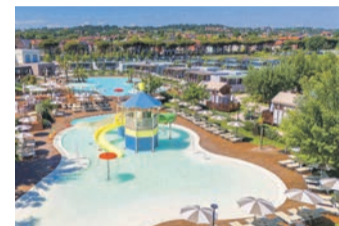
Sentido Riccione Premium Camp