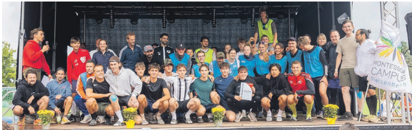
Siegerehrung mit den drei Erstplatzierten

Mit Temperaturen um die 30 Grad und strahlendem Sonnenschein hatten die zahlreichen Läufer bei dem Lauf am Wochenende zu kämpfen, was allen Aktiven einiges abforderte. Aber auch das Bewässern der Bahn und der Läufer wurde dabei nicht vergessen. Das Fahrzeug mit dem Wassertank war in dieser Zeit ständig un-